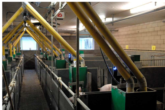
Afdeling met vleesvarkens

De vleesvarkensstallen vormen een aparte eenheid wanneer ze onderdeel uitmaken van een gesloten bedrijf. Er is altijd sprake van een ruimtelijke scheiding met andere diercategorieën. Moderne stallen zijn uitgevoerd als brede één-kapper met een centrale werkgang onder de nok of als twee-kapper met een centrale werkgang in een overkapte tussenruimte tussen beide stallen in. De afdelingen met vleesvarkens staan haaks op deze werkgang en zijn uitgevoerd met een smal controlepad (ca. 80 cm) met aan weerszijde de hokken met vleesvarkens. De afdelingen beschikken niet over een buitendeur. Vleesvarkens worden gehuisvest in hokken met 12 – 15 dierplaatsen. De dieren moeten de beschikking hebben over een dicht vloergedeelte. Er wordt gebruik gemaakt van relatief smalle en diepe hokken (verhouding 1:2) voorzien van een dichte bolle vloer met een weerszijde roosters. Een typische vleesvarkensafdeling is 9 - 10 meter breed. De afdelingsdiepte is afhankelijk van het aantal dierplaatsen en varieert in de praktijk van ca. 13 tot ruim 20 meter. Binnen een brandcompartiment van 2500 m 2 kunnen maximaal 2500 vleesvarkensplaatsen worden gerealiseerd.