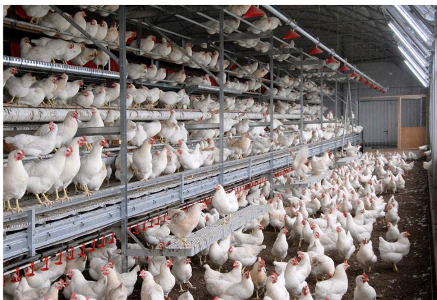
Volièrestal met leghennen

In Nederland (in de EG) is traditionele batterijhuisvesting voor leghennen verboden. De nog toegestane vormen van kooihuisvesting zijn de verrijkte kooi en koloniehuisvesting. Beide zijn grotere kooien voor groepen dieren. In de kooien (met roostervloer) zijn een scharrelgelegenheid (vaak een rubberen mat), zitstokken en een legnest (afgeschermd hoek) aanwezig. De voervoorziening kan buiten de kooi langs lopen (voergoot met ketting) of door de kooien heen (zowel voergoot als voerpannen). De drinkwatervoorziening loopt door de kooien. Onder de kooien is een mestband aanwezig waarmee de mest 2x per week uit de stal wordt gehaald. De mest wordt gedroogd met lucht uit PVC-buizen. De verlichting kan zowel tegen het dak zijn gemonteerd als tussen de rijen met kooien. Meestal zijn het hoog frequente TL-buizen. Ook komt verlichting gemonteerd in de kooien voor.