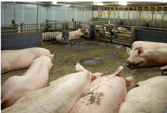
Dragende zeugen in groepshuisvesting

Op (oudere) bedrijven met bestaande bebouwing wordt de materiaalkeuze van nieuwe stallen vaak afgestemd op het bestaande. Op oudere bedrijven zien we vaak verschillende, relatief kleine stallen met afmetingen van ca. 15 x 50 meter. De stallen zijn op een onderlinge afstand van 5 – 12 meter van elkaar geplaatst. Deze stallen zijn gebouwd van steen en vaak met dragende afdelingsmuren die tot in de nok van de stal doorlopen. Eventuele spanten zijn van ijzer (geplaatst op de muurplaat) of hout (vakwerk). Op het dak vezelcement golfplaten (oudere stallen vaak nog asbest). Onder de gordingen is isolatie aangebracht. Dit zijn harde platen soms nog van PS, maar veelal PUR met een cachering of soms spuitisolatie direct tegen de golfplaat. Vaak is de oorspronkelijke dakisolatie bij een interne renovatie al een keer vervangen. In oudere stallen is de centrale gang langs één van de zijgevels gesitueerd met de afdelingen aan één zijde haaks hierop. De stallucht wordt d.m.v. een zelfstandig ventilatiesysteem per afdeling (dakkoker met ventilator) afgevoerd. Natuurlijke ventilatie komt nauwelijks voor.