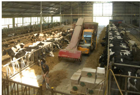
Ligboxenstal met melkkoeien

De huisvesting van biologisch melkvee wijkt niet wezenlijk af van dat van regulier melkvee. Een gangbare ligboxenstal voldoet, mits er voldoende dichte vloer aanwezig is. Op een aantal biologische bedrijven wordt het melkvee in een potstal op stro gehouden. Opslag van stro in het stalverblijf komt daarbij voor. Voor biologisch melkvee is weidegang in het groeiseizoen verplicht.