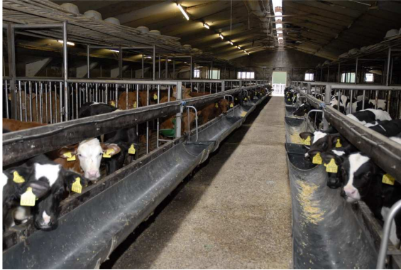
Stal met vleeskalveren

gestart waarin kalveren op roostervloeren worden gehouden met een zachte indrukbare afdekking (rubber mat). Zo'n zachte ondergrond wordt ook gevraagd t.b.v. het Beter Leven kenmerk. Voor emissiereductie wordt geëxperimenteerd met roostervloeren voorzien van flappen die de luchtuitwisseling met de mestkelder verminderen, en met banden- en schuifsystemen onder de roostervloer om mest en urine snel en effectief uit de stal te verwijderen. Luchtwassers zijn inmiddels bewezen techniek, maar duur voor toepassing in de kalverhouderij.