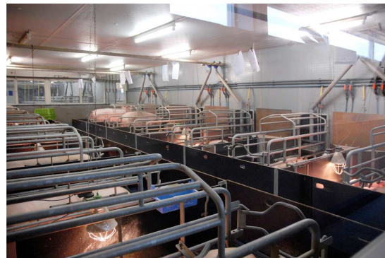
Zeugen in de kraamstal

De stallen hebben weinig buitendeuren (vaak alleen aan de einden van de centrale gang en bij de hygiënesluis). Ramen worden eveneens zeer mondjesmaat toegepast.