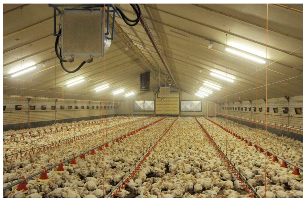
Stal met vleeskuikens

Bij het plaatsen van de dieren is een laag strooisel aanwezig, meestal houtkrullen. De stal wordt dan op een temperatuur van 32-35 °C gebracht.