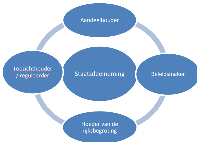
Figuur 1 Staatsdeelneming en de overheid