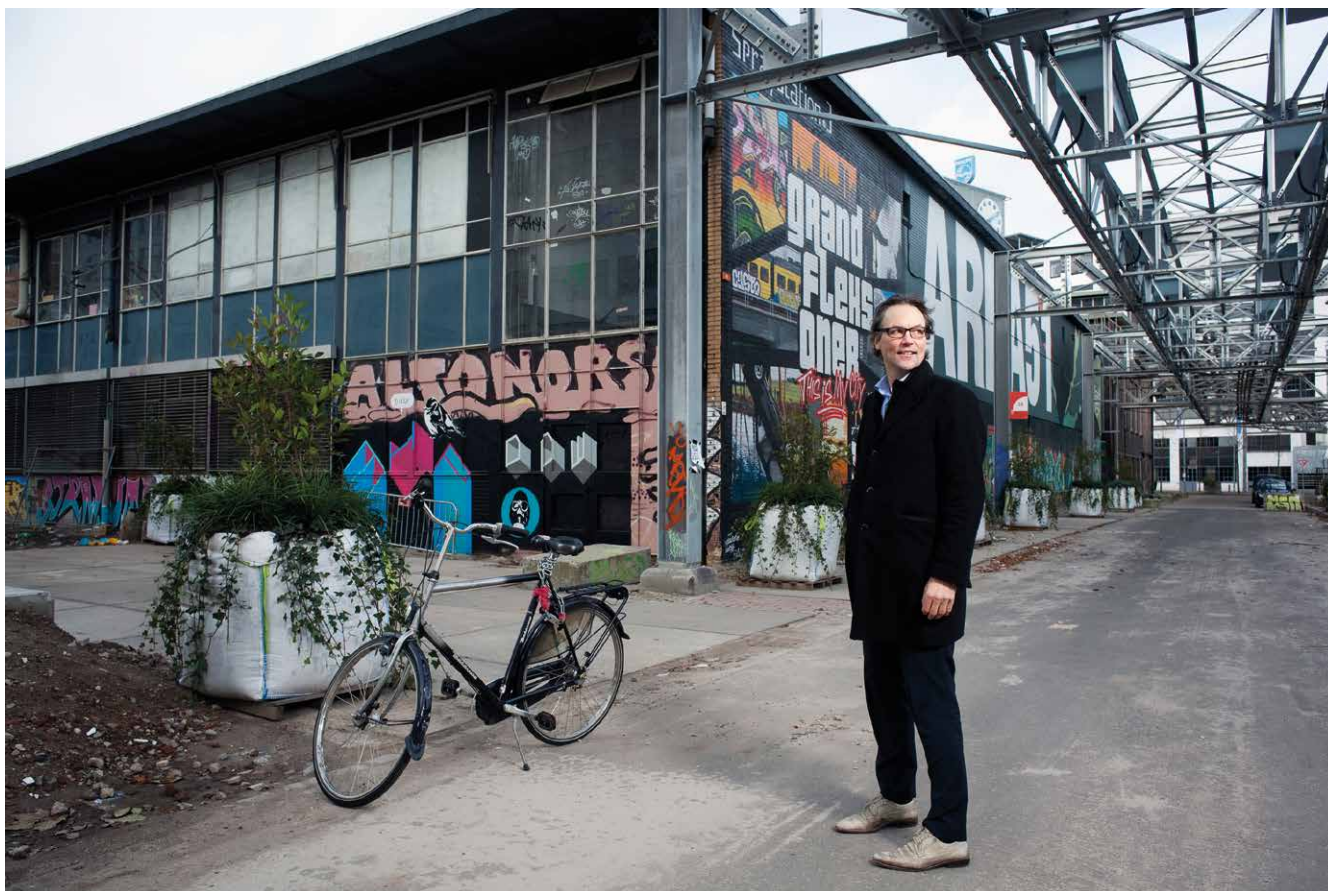
Staf Depla bij skatehal Area 51 op het terrein Strijp-S van het voormalige Philipsterrein in Eindhoven

Staf Depla kwam in 2003 in de Tweede Kamer als woordvoerder wonen, wijken, stadsvernieuwing, AOW, pensioenen en ‘bestrijding van de bureaucratie’. Ook het toenmalige kabinet wilde de regeldruk aanpakken. Depla was het daarmee eens, maar waarschuwde dat het terugdringen van het aantal regels op zich niet het hoofddoel moest zijn. Belangrijker vond hij het dat die regels werden aangepakt waar burgers en bedrijven de grootste hinder van ondervonden. Een grote stelselherziening zou concreet resultaat te veel op de lange baan kunnen schuiven. Tien jaar later is hij wethouder financiën van Eindhoven met onder meer de ontwikkeling van de Spoorzone en het programma ‘minder regels/goed geregeld’ in zijn portefeuille.