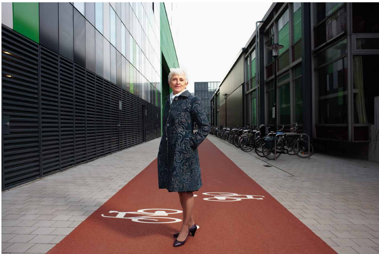
Jacqueline Cramer naast woontoren Casa Confetti op het universiteitsterrein De Uithof te Utrecht

“Bestaande regelgeving vormt regelmatig een belemmering voor innovatieve duurzaamheidsprojecten en gebiedsontwikkelingen. Ik was daarom als minister van VROM voorstander van de Crisis- en herstelwet. Veel mensen hadden aarzelingen omdat de wet eenzijdig uit de hoek van de wegebouw leek te komen. Ik zag juist kansen om ook onze punten in te brengen.”