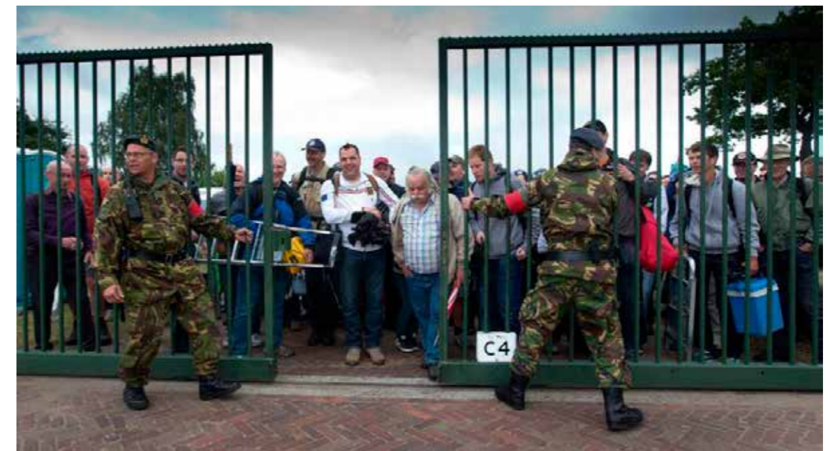
Groep Luchtmacht Reserve