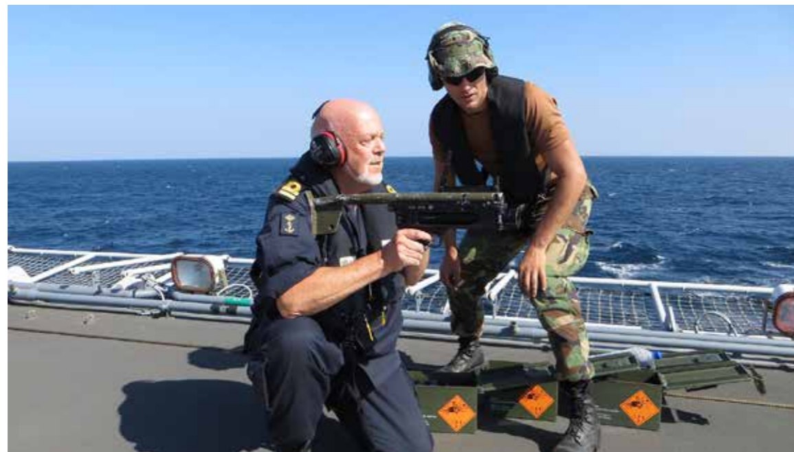
Reservist bij operatie Atalanta