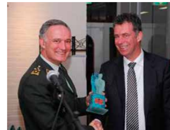
Generaal Tom Middendorp, Commandant der Strijdkrachten, overhandigt de award voor de Reservistenwerkgever 2013.