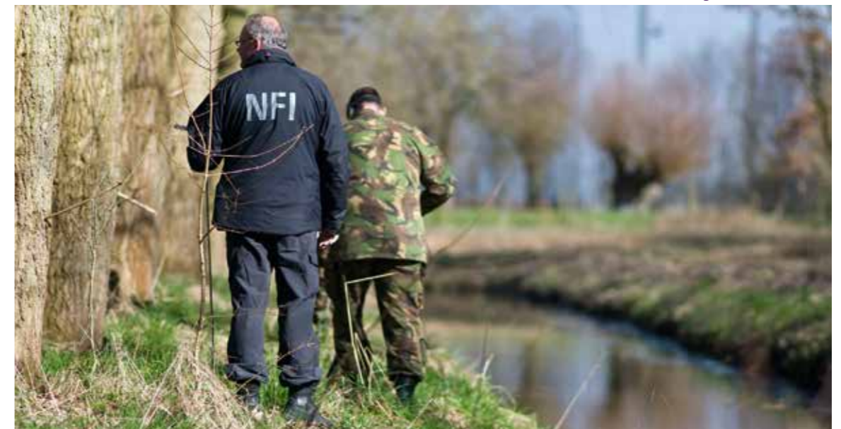
Ondersteuning civiele autoriteiten