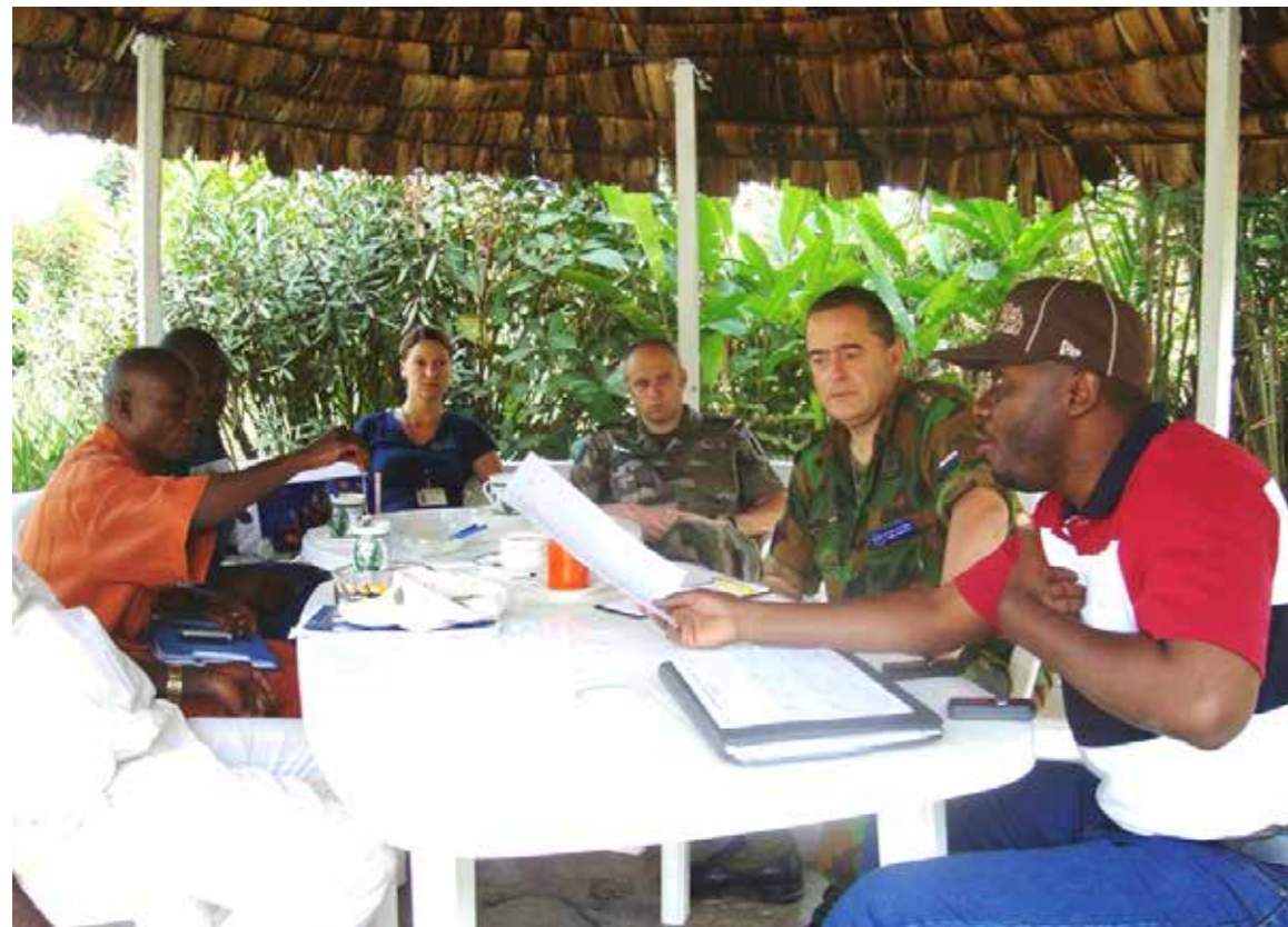
Reservist van 1 CMI Co in Afrika

Binnen de krijgsmacht bestaan vacatures die soms moeilijk gevuld kunnen worden. Reservisten kunnen natuurlijk een rol spelen bij het vervullen van die vacatures voor de periode dat zoiets wenselijk/nodig is.