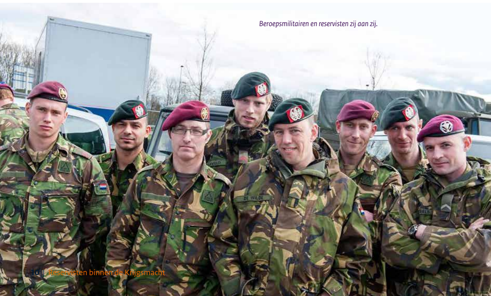
Beroepsmilitairen en reservisten zij aan zij.

Commandanten van eenheden op alle niveaus zullen in de toekomst de vruchten plukken van het nieuwe beleid. Door een bredere inzet van reservisten wordt de schaarste aan specifieke kennis opgevangen. Bovendien is bij alle defensieonderdelen sprake van een groter operationeel aanpassingsvermogen. Piekbelastingen bij inzet van de krijgsmacht kunnen dan beter worden opgevangen.