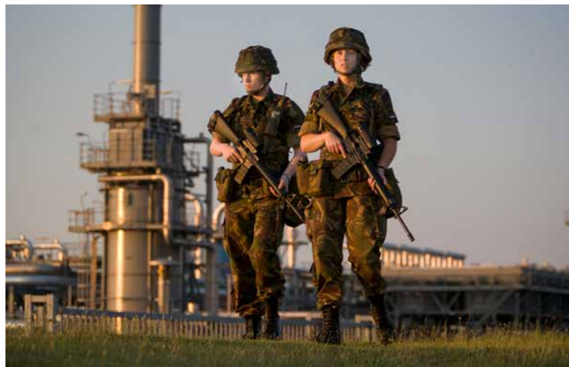
Reservisten van de Natres