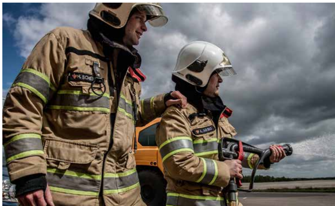
Inzet reservisten bij bluswerkzaamheden