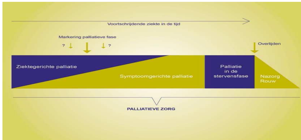
Figuur 2. Het zorgmodel van Lynn & Adamson (2003)

In grote delen van de samenleving is de dominante opvatting dat bij ziekte gestreden behoort te worden tegen de dood: "Opgeven is geen optie". Deze opvatting is uiteraard te respecteren maar er is daardoor -zelfs voor terminale patiënten- soms weinig ruimte voor acceptatie van en overgave aan ziekte en het naderend overlijden. De focus moet meer komen te liggen op de kwaliteit van leven en de keuzes die er zijn, en te bevorderen dat het niet starten of staken van een -op genezing of levensverlenging gerichte- behandeling ook passend kan zijn (Niet alles wat kan hoeft, 2015). Dat geeft ook meer ruimte voor de inzet van palliatieve zorg.