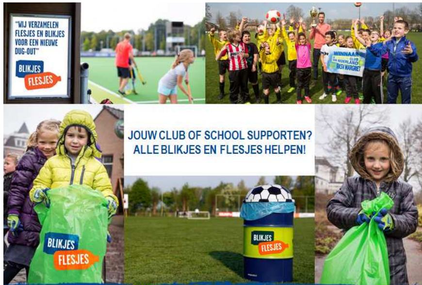
Figuur 4: voorbeelden communicatie op te zetten pilots met scholen en sportverenigingen