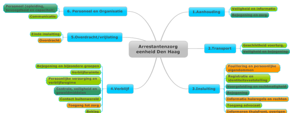
Figuur 5: Eindoordeel proces arrestantenzorg en deelaspecten

In de voorgaande hoofdstukken zijn verschillende aspecten van de arrestantenzorg aan de orde gekomen. Over een aantal onderwerpen hierbinnen zijn de inspecties erg positief en een aantal onderwerpen verdienen nog aandacht. Onderstaande figuur geeft een totaaloverzicht van de wijze waarop het proces arrestantenzorg functioneert op alle getoetste aspecten en daarbij behorende onderwerpen. In deze figuur is met kleurcodes aangegeven in welke mate de arrestantenzorg voldoet aan de gestelde normen en verwachtingen op de verschillende onderwerpen binnen de toetsingskaders van IVenJ en IGZ: donkergroen wil zeggen dat de arrestantenzorg volledig voldoet, lichtgroen wil zeggen voldoet overwegend maar niet volledig, oranje houdt in dat de arrestantenzorg in beperkte mate voldoet aan de criteria en een rode kleur wil zeggen dat de arrestantenzorg niet voldoet.