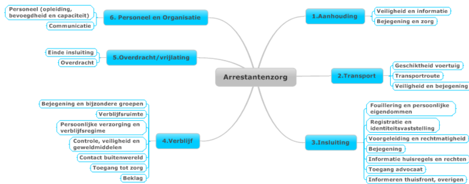
Figuur 2: Overzicht proces arrestantenzorg en deelaspecten

Aan de hand van interviews, dossier- en documentenstudies en observaties gaan de inspecties na hoe de politie uitvoering geeft aan arrestantenzorg. Per eenheid spreken de inspecties met de volgende respondenten: