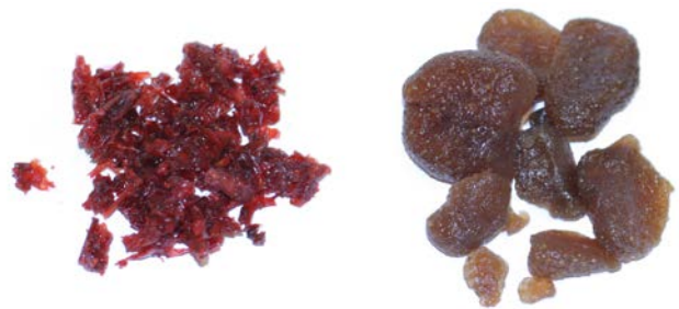
Figuur 2: Waterpijptabak en gedroogde vruchten (aardbei)

Er kunnen verschillende soorten kruiden worden gerookt. Voorbeelden zijn theebladeren in combinatie met suikerrietvezels, en kruiden met een rustgevendende werking zoals lavendel, bijvoet en eucalyptus. De exacte samenstelling van gebruikte kruidenmengsels is vaak onbekend. Voorbeelden van gedroogde vruchtenmengsels zijn vruchtenstukjes en vruchtengelei gemengd met melasse in populaire smaken als appel, mint, watermeloen en aardbei. Als alternatief voor tabak, kruiden of gedroogde vruchten worden ook wel aromatische stoom- of dampstenen gebruikt. Deze steentjes zijn doordrenkt met een aroma. Het aroma verdampt tijdens het roken en wordt vervolgens geïnhaleerd (5).