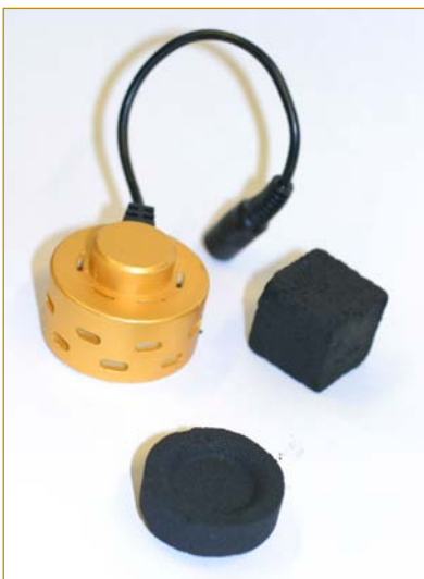
Figuur 3: Enkele verhittingsbronnen: elektrisch kooltje, quick-light-kooltje en natuurkooltje (kokos)

CO ontstaat door onvolledige verbranding van de kooltjes. Deze onvolledige verbranding kan niet voorkomen worden door de kooltjes op een andere manier te gebruiken. CO komt vrij bij de verhitting van alle niet-elektrische kooltjes. Het deel van de kooltjes dat niet verbrandt komt vrij als rook (8). Bij het roken van een waterpijp komt meer CO vrij dan bij het roken van sigaretten. Dit kan wel tot 30 keer meer zijn.