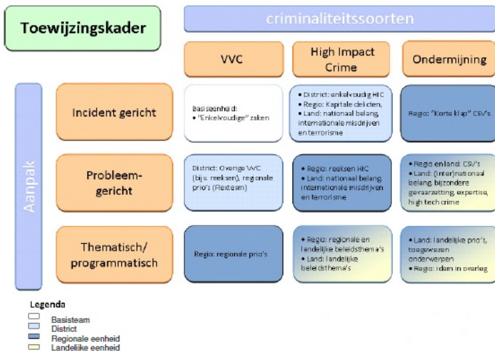
Fig. 2 Toewijzingskader Landelijke Werkingsdocument Opsporing

van het speelveldmodel. Volgens het toewijzingskader is het basisteam primair verantwoordelijk voor de aanpak van VVC en de districtsrecherche voor de incidentgerichte aanpak van High Impact crimes (HIC) en de probleemgerichte aanpak van VVC.