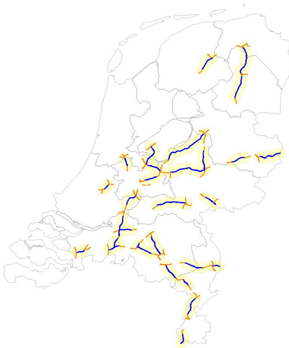
Figuur 1 De door Rijkswaterstaat aangeleverde wegvakken waarop de maximum snelheden in 2016 zijn verhoogd (blauw), alsmede de daarop aansluitende wegvakken (oranje) tot vijf kilometer van de aangepaste wegvakken, de invloedsgebieden. De gebieden van 5 km rondom de wegen zijn geel..

De monitoring van het NSL kijkt in monitoringsronde 2016 alleen naar de luchtkwaliteit in de jaren 2015, 2020 en 2030, er zijn dan ook geen verkeerscijfers beschikbaar voor het jaar 2016. Om de invloed van alle wegen van andere wegbeheerders dan Rijkswaterstaat in rekening te brengen zijn de gegevens van Rijkswaterstaat dan ook gecombineerd met de invoer in de NSL monitoring voor het jaar 2015. De door Rijkswaterstaat geleverde verkeerscijfers zijn door het uitgaan van meer recente prognose van de verkeersstromen niet vergelijkbaar met de cijfers die in de monitoringtool voor 2015 zitten, ook niet voor de tracés in de aansluitende invloedsgebieden waar de maximum snelheden niet zijn verhoogd.