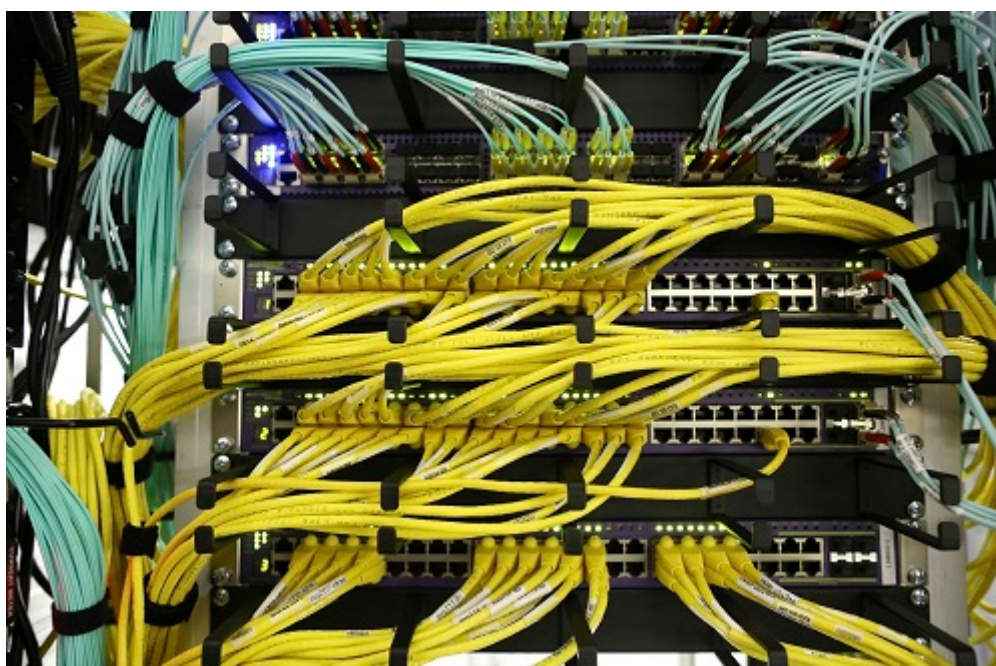
Afbeelding 4. De Inspectie richt haar toezicht zowel op de voorbereiding op fysieke dreigingen als op digitale en sociale dreigingen.

Inspectie richt haar toezicht op zowel de voorbereiding op fysieke dreigingen als op digitale en sociale dreigingen. De wijze waarop organisaties inspelen op risico's en maatschappelijke ontwikkelingen is daarbij een aandachtspunt. De Inspectie geeft het toezicht op Nationale veiligheid steeds meer gestructureerd vorm. Er wordt ingezet op het periodiek opstellen van beelden over de rampenbestrijding, brandweer en GHOR. De focus van het toezicht komt daarbij meer te liggen op het toetsen van de daadwerkelijke kwaliteit en kwaliteitsontwikkeling. Daarnaast voert de Inspectie in 2017 een verkenning uit naar cybersecurity.