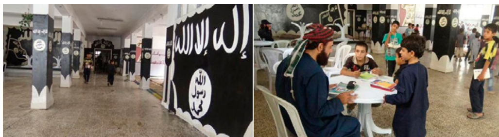
Binnenin een ISIS-school zoals in propaganda geportretteerd

Uit ISIS-propaganda komt naar voren dat onderwijs een cruciale rol speelt in het 'kalifaat'. Dit blijkt onder andere uit de oprichting van het 'ministerie van educatie' dat onderwijs voor jongens tussen 6 en 18 jaar en meisjes tussen 6 en 15 jaar verplicht heeft gesteld. 6 Het is onwaarschijnlijk dat, ondanks deze verplichtstelling, alle kinderen in ISIS-gebied daadwerkelijk naar school gaan. Waarschijnlijk houdt een aanzienlijk deel van de lokale bevolking, en mogelijk ook sommige buitenlandse strijders, hun kinderen thuis. Daarnaast zijn er steeds minder goed functionerende scholen door de verslechterde veiligheids-situatie. Of zijn scholen door een gebrek aan personeel gedwongen om - al dan niet tijdelijk - de deuren te sluiten.