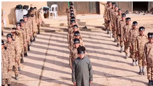
Beeld uit propagandavideo over trainingskamp voor kinderen

Jongens kunnen ook aangemeld worden door hun ouders, of zelfstandig besluiten bij zo'n kamp te gaan. Deze kampen volgen het voorbeeld van trainingskampen voor volwassenen. Jongens kunnen mogelijk al vanaf 9 jaar meedoen en worden daar ingedeeld in gespecialiseerde richtingen als strijder, aanslagpleger, bommenmaker of sluipschutter. De opleiding bestaat uit een ideologische en militaire vorming. Een dag in een trainingskamp bestaat bijvoorbeeld uit het volgen van Koranlessen, fysieke training en het leren van tactieken, zoals het oefenen van onthoofden op een pop.