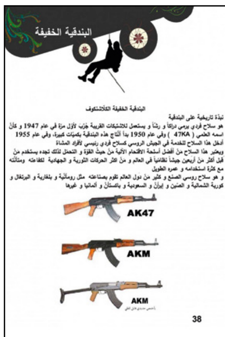
Pagina uit ISIS-lesboek over inzet en gebruik wapens

De lesboeken, zoals het basisschoolboek 'Ik ben moslim', onderbouwen een wereldbeeld waarbij de ideeën van ISIS juist zijn en alle andere onjuist. Lesmateriaal is geïllustreerd met afbeeldingen van handgranaten, tanks en gevechtsposities: zo wordt het onderwijs gekoppeld aan de militaire strategie van ISIS. Daarnaast krijgen kinderen theorieles over onderwerpen die met de strijd te maken hebben, zoals het herkennen van verschillende wapentypes, en in welke situatie deze het best ingezet kunnen worden. Een belangrijke focus in het curriculum is het versterken van het wij-zij-gevoel. De 'kruisvaarderscoalitie' (waar Nederland deel van uitmaakt) is hier de vijand die uitgeroeid zou moeten worden. 7 Iedereen die zich niet tegen de coalitie uitspreekt wordt bestempeld als ongelovige of, in het geval van moslims, als afvallige. Dit betekent volgens ISIS dat hij of zij gedood mag worden.