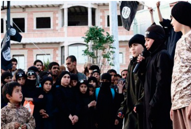
Minderjarige prediker in propagandavideo

Sommige minderjarigen vervullen een specifieke rol in het ‘kalifaat’: dit kan uiteenlopen van huisvrouw of verklikker tot soldaat of beul. Kinderen, zowel jongens als meisjes, worden aangespoord informatie te delen over familieleden, burens of vrienden die zich niet conformeren aan de regels van ISIS. Hierbij functioneert het ‘kalifaat’ als een totalitaire staat die controle wil over zijn burgers. De inzet van kinderen voor dergelijke rollen is gebruikelijk in een totalitair regime. Als de kinderen bewijzen loyaal aan ISIS te zijn, door deze rol naar behoren te vervullen, kunnen ze doorgroeien naar een rol met meer verantwoordelijkheid.