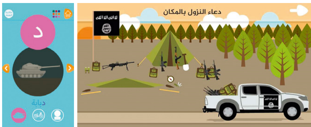
Apps voor jonge kinderen

Deze beïnvloeding van kinderen gebeurt al op vroege leeftijd. De app Huroof (alfabet), bestemd voor de allerjongsten, leert ze spelenderwijs gewelddadige of jihadistische woordjes, zoals 'dababa' (tank). Ook zijn er apps waarin kinderen spelenderwijs de coalitielanden kunnen aanvallen, door bijvoorbeeld raketten af te vuren op westerse gevechtsvliegtuigen of de Eiffeltoren.