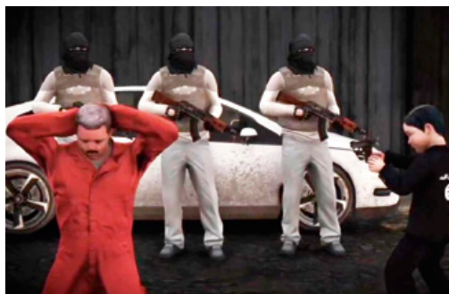
Beeld uit propagandavideo die het videospel imiteert

Europa. Andere video's toonden minderjarigen die optraden als beulen en op camera gevangenen vermoordden. Hierbij werd realiteit dikwijls met een (video)spel gecombineerd door de manier van filmen vanuit het perspectief van de schutter. Ook zeer jonge kinderen hebben executies uitgevoerd op camera. In een video uit januari 2017 schoot een kleuter een 'PKK-gevangene' dood, en keek toe hoe een iets oudere jongen een andere gevangene onthoofdt.