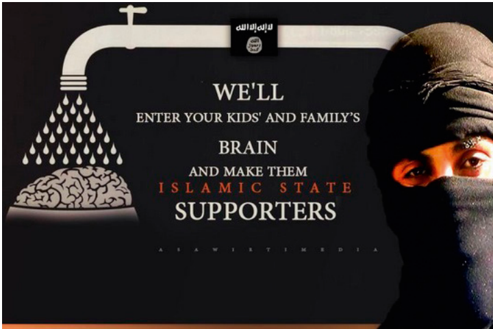
Voorbeeld van ISIS-propaganda