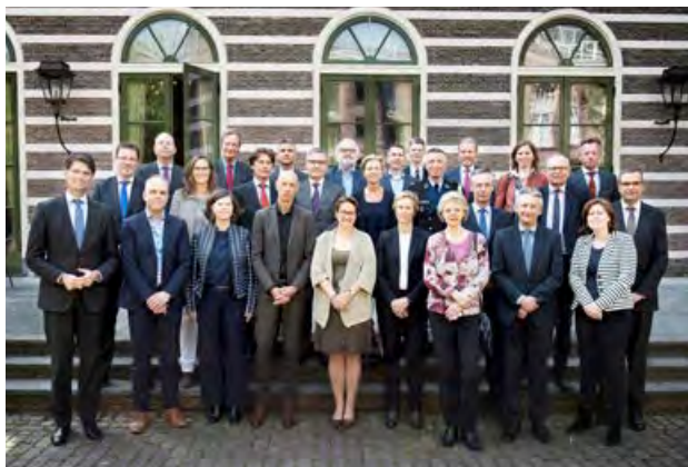
Bestuurders uit de strafrechtketen op 20 april 2017 werken samen aan maatschappelijke ambitie.

Bij de beantwoording van deze vragen zijn actoren van binnen én buiten de strafrechtketen betrokken geweest. De opbrengsten zijn in dit stuk bijeen gebracht en beschreven. Op basis van een analyse van deze opbrengsten heeft de top van de strafrechtketen op 20 april 2017 een belangrijke basis gelegd voor een gezamenlijke en een maatschappelijke ambitie van de strafrechtketen. Gezamenlijk hebben zij vier lijnen onderscheiden waarop de keten zich de komende jaren zal ontwikkelen. Deze vormen tevens de basis voor de maatschappelijke ambitie van de keten. Daarmee kan de strafrechtketen komende jaren met een gezamenlijke missie en goed aangehaakt op de veranderende maatschappij aan de slag!