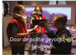
Door de politie gevolgd, eh, gevlogd!