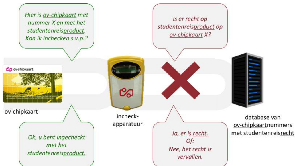
Figuur 2 – Inchecken met het studentenreisproduct. Een connectie met een database om het reisrecht te controleren is niet beschikbaar bij in- en uitchecken. Om deze reden bestaat een dergelijke database ook niet: informatie over vervallen reisrechten is niet aanwezig in het ov-chipkaartsysteem.

In het ov-chipkaartsysteem is de kaart dus leidend. Dit betekent enerzijds dat het studentenreisproduct bij in- en uitchecken ook geaccepteerd wordt wanneer het recht erop is vervallen, want die informatie is niet ter plekke. Anderzijds betekent het dat het studentenreisproduct alleen bij een ophaalautomaat 8 stopgezet kan worden.