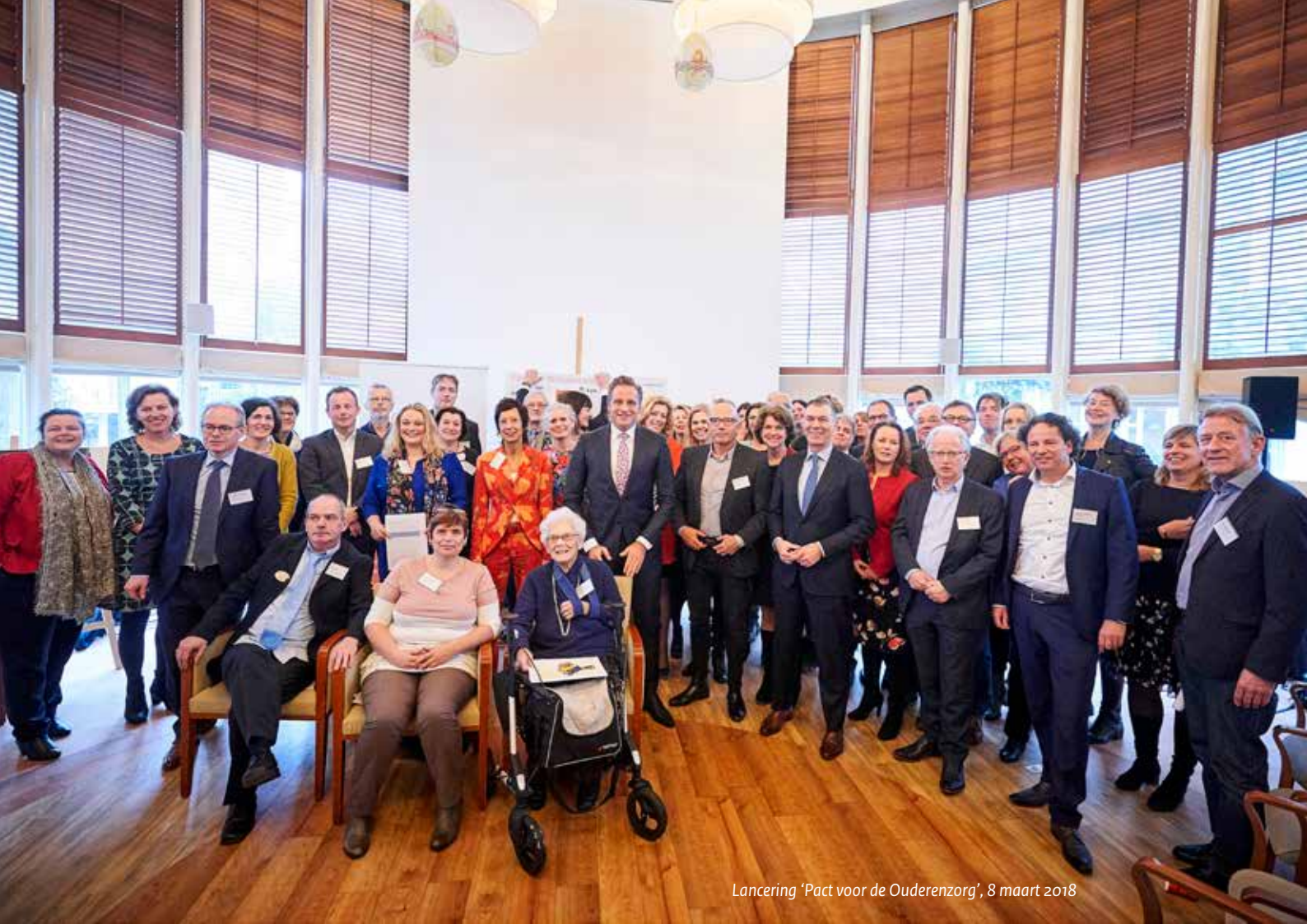
Lancering 'Pact voor de Ouderenzorg', 8 maart 2018