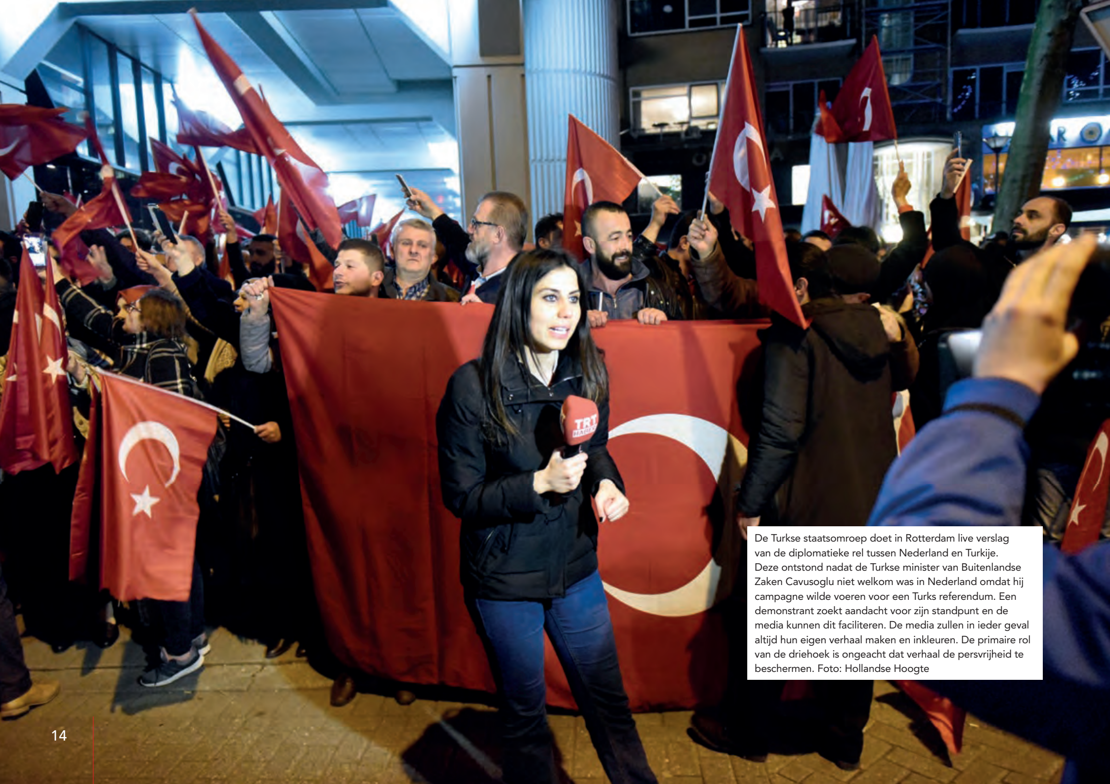
De Turkse staatsomroep doet in Rotterdam live verslag van de diplomatieke rel tussen Nederland en Turkije. Deze ontstond nadat de Turkse minister van Buitenlandse Zaken Cavusoglu niet welkom was in Nederland omdat hij campagne wilde voeren voor een Turks referendum. Een demonstrant zoekt aandacht voor zijn standpunt en de media kunnen dit faciliteren. De media zullen in ieder geval altijd hun eigen verhaal maken en inkleuren. De primaire rol van de driehoek is ongeacht dat verhaal de persvrijheid te beschermen.