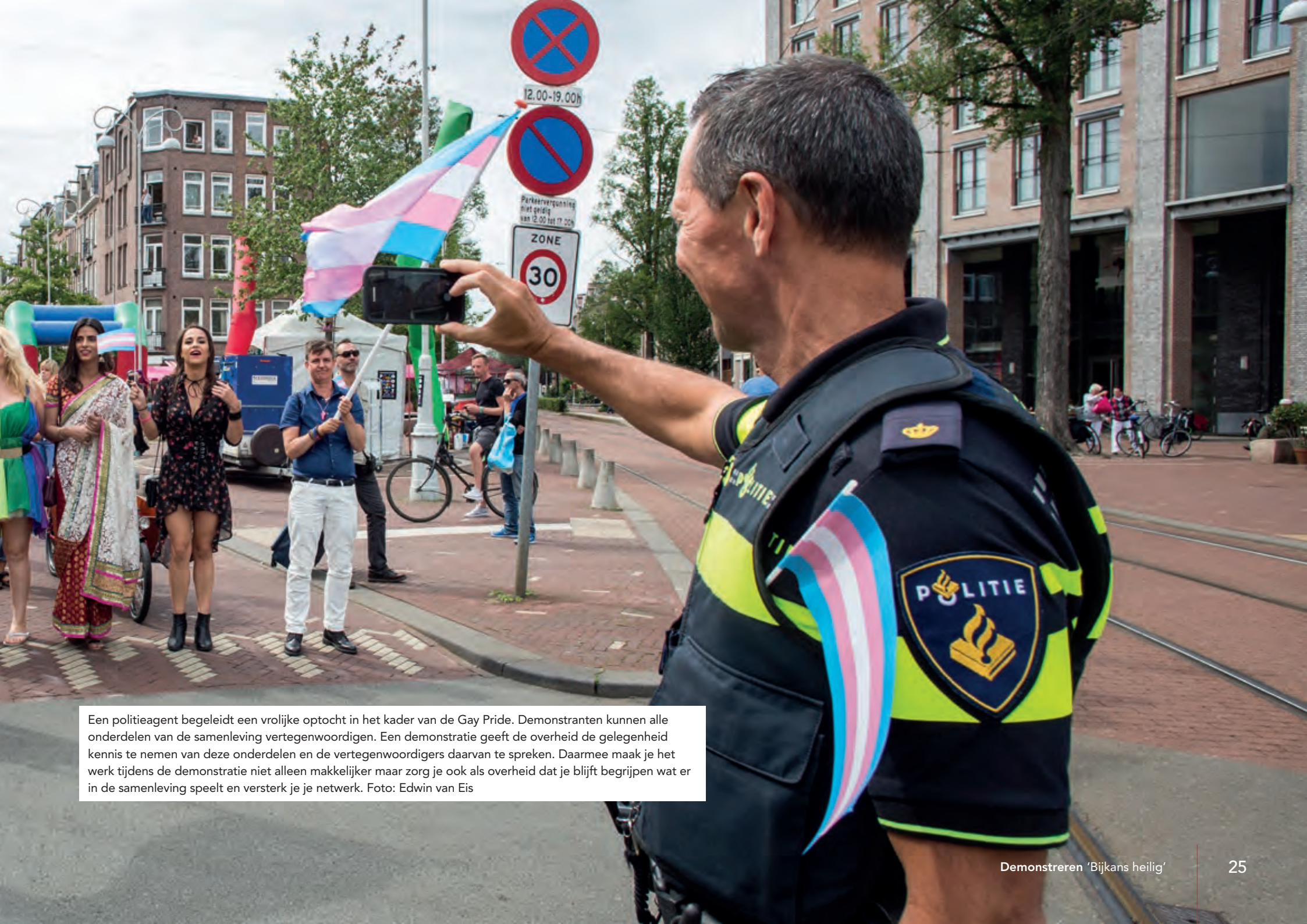
Een politieagent begeleidt een vrolijke optocht in het kader van de Gay Pride. Demonstranten kunnen alle onderdelen van de samenleving vertegenwoordigen. Een demonstratie geeft de overheid de gelegenheid kennis te nemen van deze onderdelen en de vertegenwoordigers daarvan te spreken. Daarmee maak je het werk tijdens de demonstratie niet alleen makkelijker maar zorg je ook als overheid dat je blijft begrijpen wat er in de samenleving speelt en versterk je je netwerk.