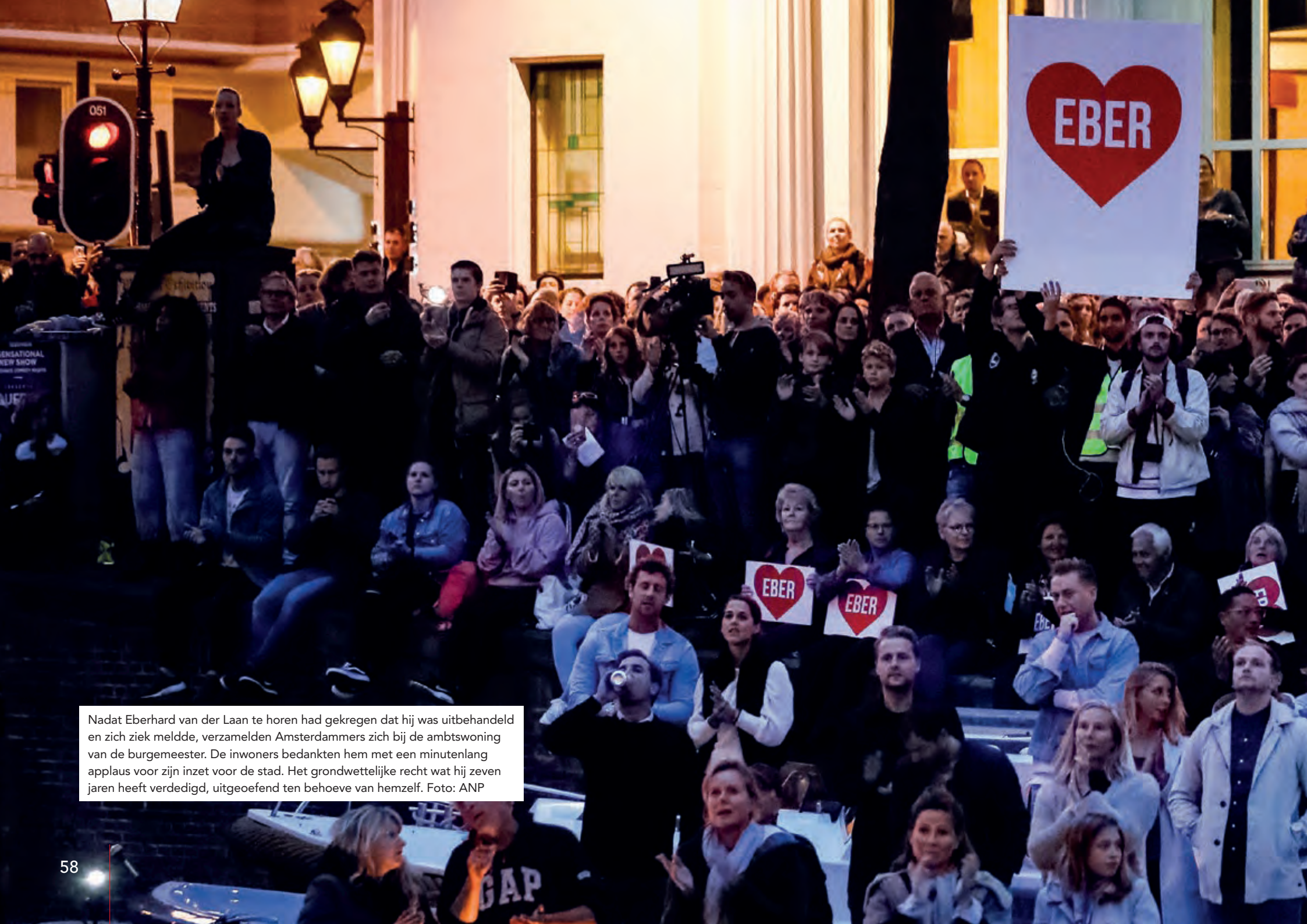
Nadat Eberhard van der Laan te horen had gekregen dat hij was uitbehandeld en zich ziek meldde, verzamelden Amsterdammers zich bij de ambtswoning van de burgemeester. De inwoners bedankten hem met een minutenlang applaus voor zijn inzet voor de stad. Het grondwettelijke recht wat hij zeven jaren heeft verdedigd, uitgeoefend ten behoeve van hemzelf.