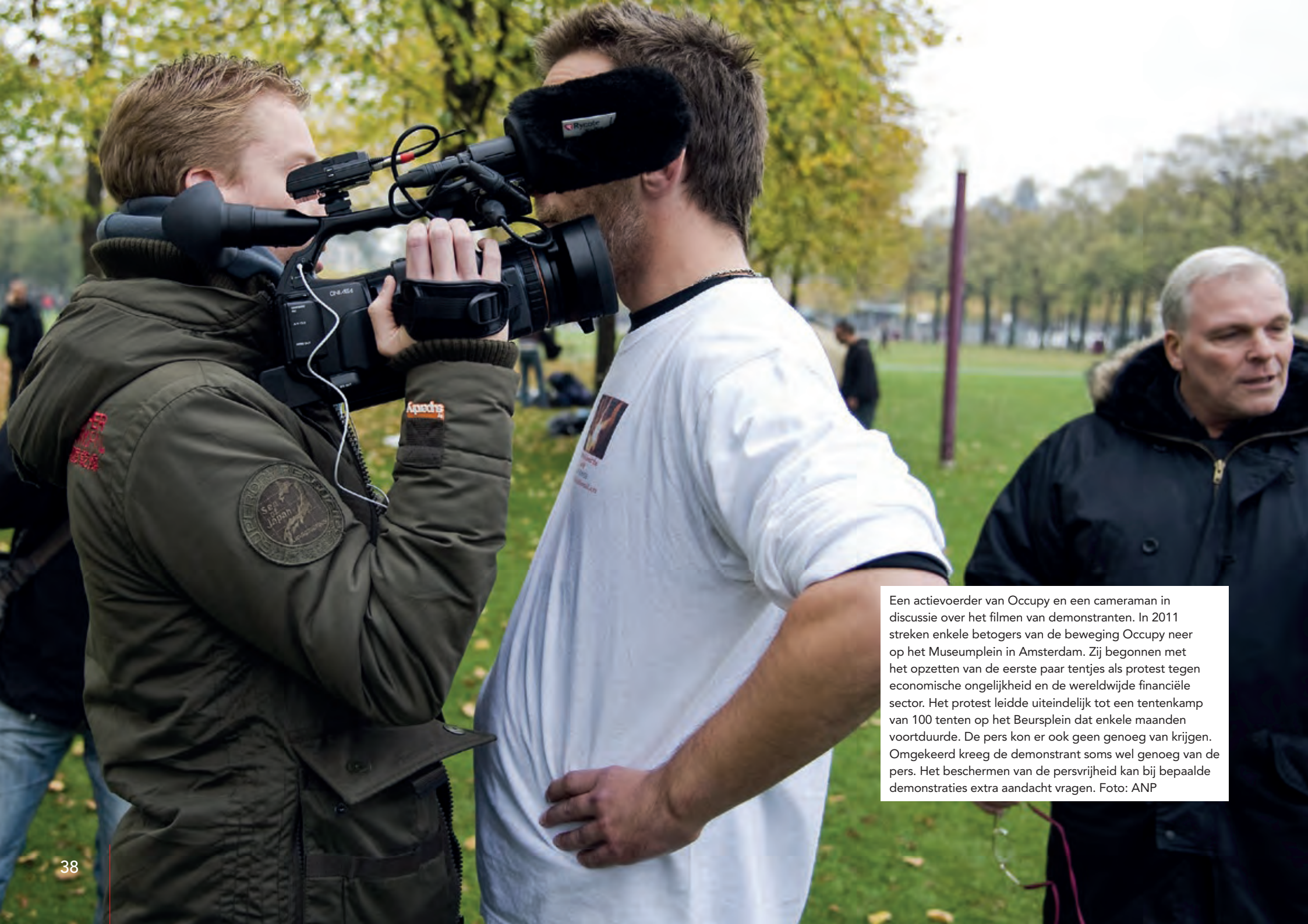
Een actievoerder van Occupy en een cameraman in discussie over het filmen van demonstranten. In 2011 streken enkele betogers van de beweging Occupy neer op het Museumplein in Amsterdam. Zij begonnen met het opzetten van de eerste paar tentjes als protest tegen economische ongelijkheid en de wereldwijde financiële sector. Het protest leidde uiteindelijk tot een tentenkamp van 100 tenten op het Beursplein dat enkele maanden voortduurde. De pers kon er ook geen genoeg van krijgen. Omgekeerd kreeg de demonstrant soms wel genoeg van de pers. Het beschermen van de persvrijheid kan bij bepaalde demonstraties extra aandacht vragen.