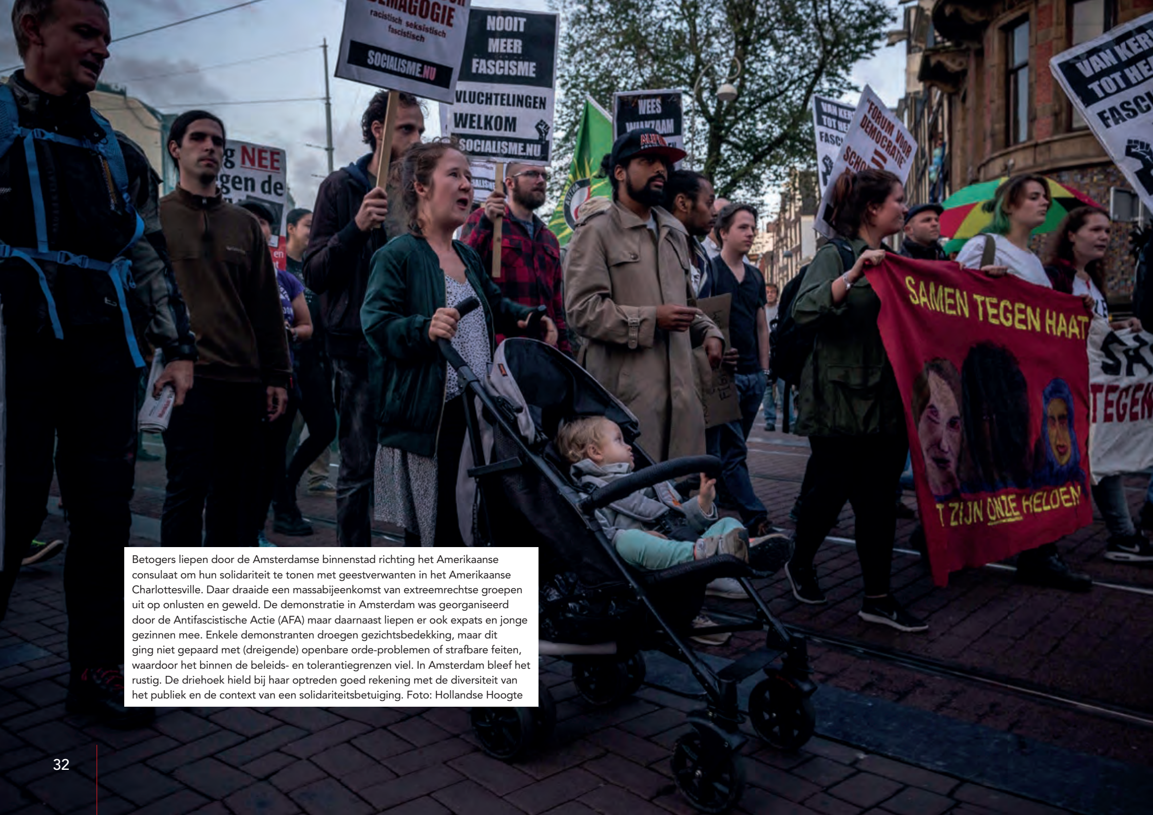
Betogers liepen door de Amsterdamse binnenstad richting het Amerikaanse consulaat om hun solidariteit te tonen met geestverwanten in het Amerikaanse Charlottesville. Daar draaide een massabijeenkomst van extreemrechtse groepen uit op onlusten en geweld. De demonstratie in Amsterdam was georganiseerd door de Antifascistische Actie (AFA) maar daarnaast liepen er ook expats en jonge gezinnen mee. Enkele demonstranten droegen gezichtsbedekking, maar dit ging niet gepaard met (dreigende) openbare orde-problemen of strafbare feiten, waardoor het binnen de beleids- en tolerantiegrenzen viel. In Amsterdam bleef het rustig. De driehoek hield bij haar optreden goed rekening met de diversiteit van het publiek en de context van een solidariteitsbetuiging.