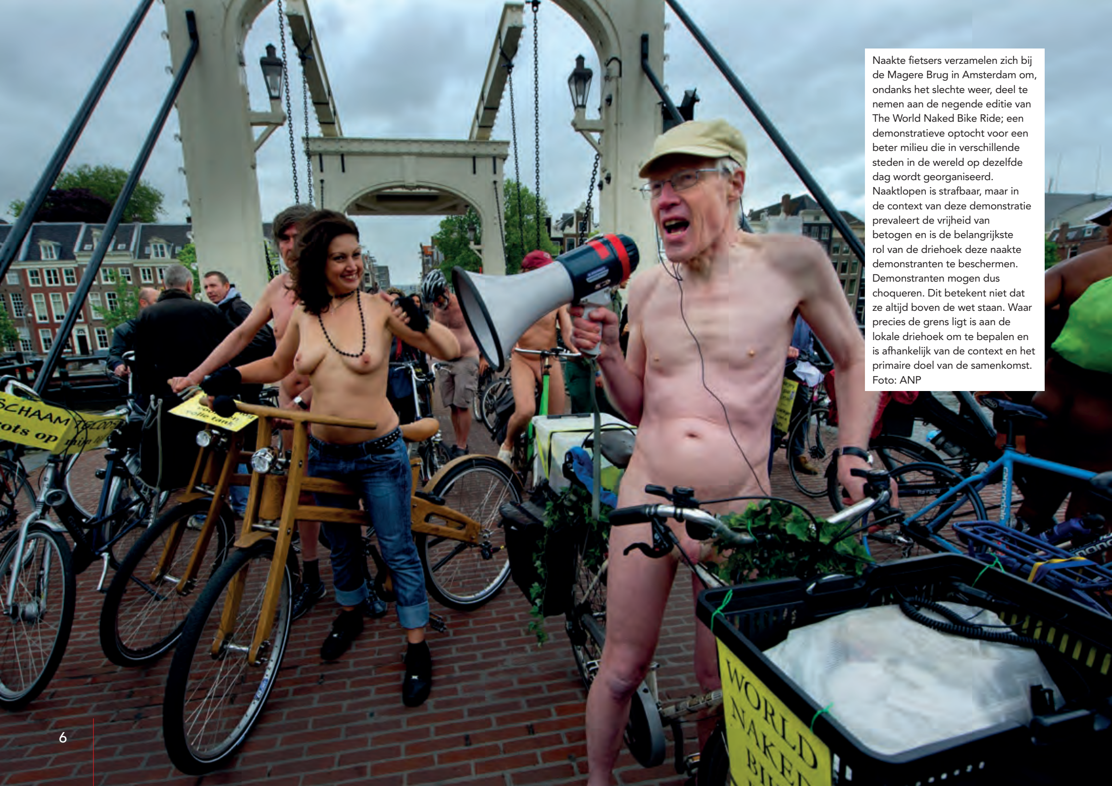
Naakte fietsers verzamelen zich bij de Magere Brug in Amsterdam om, ondanks het slechte weer, deel te nemen aan de negende editie van The World Naked Bike Ride; een demonstratieve optocht voor een beter milieu die in verschillende steden in de wereld op dezelfde dag wordt georganiseerd. Naaktlopen is strafbaar, maar in de context van deze demonstratie prevaleert de vrijheid van betogen en is de belangrijkste rol van de driehoek deze naakte demonstranten te beschermen. Demonstranten mogen dus choqueren. Dit betekent niet dat ze altijd boven de wet staan. Waar precies de grens ligt is aan de lokale driehoek om te bepalen en is afhankelijk van de context en het primaire doel van de samenkomst.