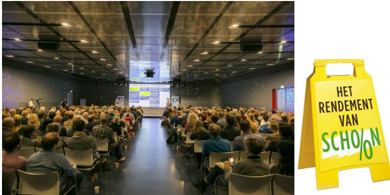
Afbeelding: Kennisuitwisseling Congres Het Rendement van Schoon, Jaarbeurs Utrecht

Ook wordt op kenniswijzerzwerfafval.nl internationale kennis gedeeld doordat NederlandSchoon deelneemt in het Clean Europe Network . Het congres Het Rendement van Schoon is het moment waarop NederlandSchoon met haar partners ervoor zorgt dat alle (inter)nationale kennis en innovaties samen komen.