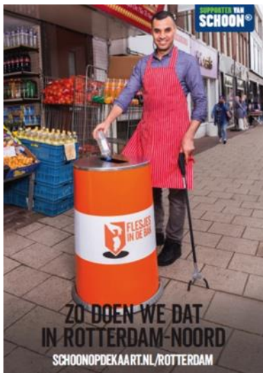
Afbeelding: Activatieposter Rotterdam-Noord