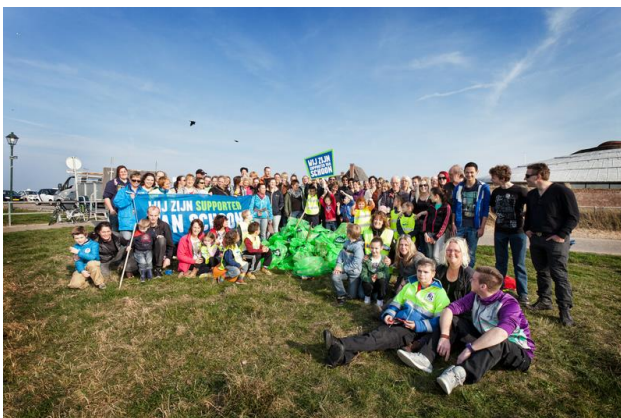
Afbeelding: Landelijke Opschoondag

Personen, bedrijven en organisaties die zich als Supporter van Schoon aanmelden, zetten zich zichtbaar in voor een schonere omgeving. Eind 2018 gaat de teller van aangemelde Supporters van Schoon richting een kwart miljoen. Het platform Supporter van Schoon enthousiasmeert en verenigt mensen om gezamenlijk in beweging te komen omdat samenwerking succesvol bijdraagt aan een schone leefomgeving. Het platform stimuleert op veel verschillende manieren waarbij de zichtbaarheid van activiteiten een rode draad vormt.