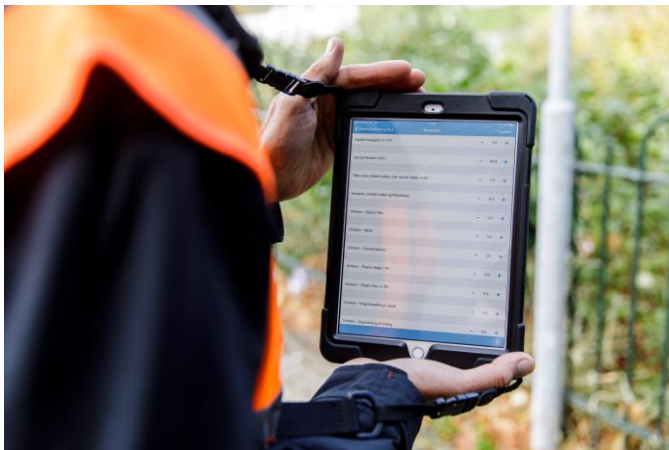
Afbeelding: Digitale monitoring

In het voorjaar van 2019 zal op basis van de resultaten uit de vier gebieden kunnen worden geadviseerd op welke wijze het private spoor de meeste bijdrage kan leveren aan de reductie- en recycle doelstellingen. Monitoring zal onderdeel blijven van de brede zwerfafvalaanpak en een bijdrage leveren aan continue optimalisering.