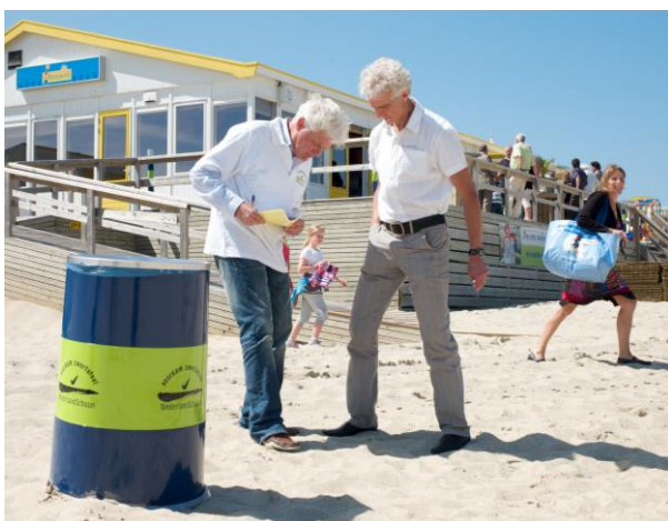
Afbeelding: Meting Schoonste Stranden Verkiezing

De Schoonste Stranden Verkiezing is in 2003 opgezet door NederlandSchoon en thans overgedragen aan organisator Strand Nederland. De metingen van de Schoonste Stranden Verkiezing vinden plaats op basis van de methode en protocollen die door NederlandSchoon zijn opgezet. NederlandSchoon is hierbij kennispartner en ziet de resultaten van de metingen als belangrijke bron van informatie. Dit geldt ook voor betrokkenheid bij, en samenwerking met, de door CROW ontwikkelde beeldlatten zwerfafval om de kwaliteit van de buitenruimte te bepalen. NederlandSchoon is betrokken bij monitoringtrajecten van Rijkswaterstaat (toepassingstraject meten van beleving en project 'Meten is weten') en CROW (standaard methodiek meten van beleving).