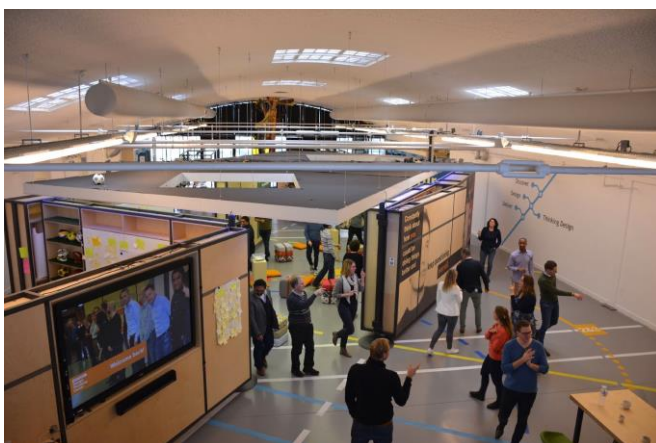
Afbeelding: Uitnodiging creatieve sessie Nextview Design Thinking Center

Via design thinking wordt naar innovatieve ideeën toegewerkt. Waarbij wordt gezocht naar de kansrijke gebieden voor het maken van grote stappen. Uit de ideeën die in dit proces ontstaan worden twee iconprojecten verder uitgewerkt in samenwerking met een selectie van bedrijven. De organisatie van een hackathon met HBO/WO-studenten zal bijdragen aan de verdere uitwerking van de innovaties. De studenten op het gebied van verpakkingsdesign, gedragsbeïnvloeding en experience design zullen zich buigen over herontwerp van verpakkingen én herontwerp van het uitgifteproces. Dit zal output leveren die enerzijds bestaat uit verpakkingsontwerpen geënt op zwerfafvalpreventie en experience design-concepten voor de gedragsaanpassing ten aanzien van de uitgifte van zwerfafvalgevoelige materialen. Het traject wordt ondersteund via sociale mediakanalen en free publicity. Het project loopt tot halverwege 2019.