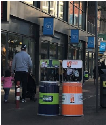
Abbeelding: "peper- en zoutopstelling" afvalbakken