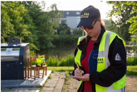
Afbeelding: Inzet handhaver

Met als doel om de bewustwording rondom zwerfafval bij alle lokaal betrokken partijen, zoals ondernemers, beleidsmedewerkers, handhavers en bewoners, te verhogen, biedt NederlandSchoon in deze pijler aan gemeenten 4 handhavingsstrategieën.