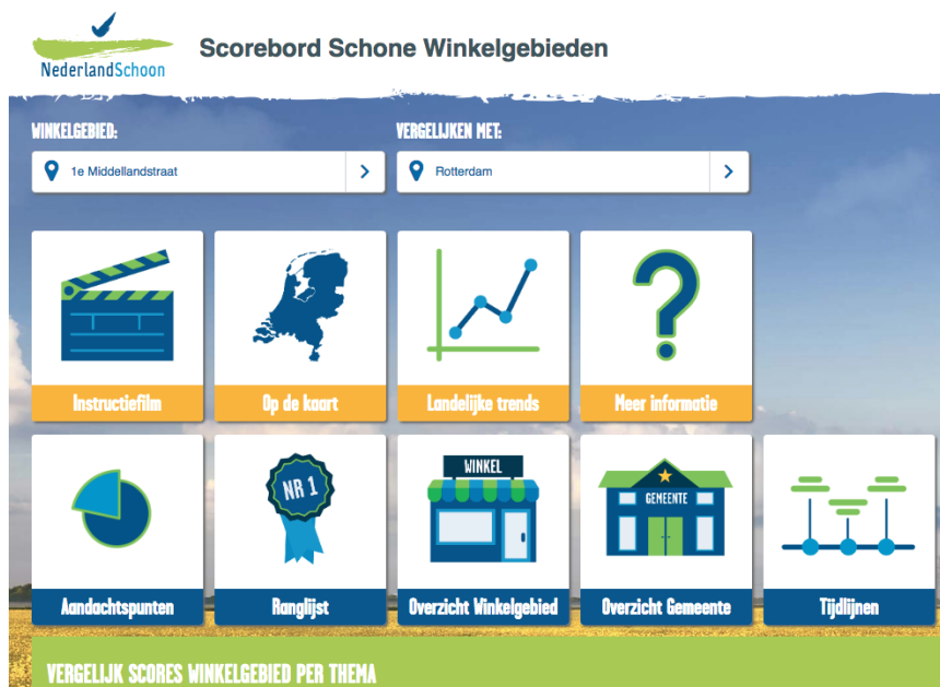
Afbeelding: Digitaal Scorebord Schone Winkelgebieden

Er wordt niet alleen gemeten op gerichte effecten van specifieke interventies maar ook op algemeen gemeentelijke trends. Positieve resultaten zijn stimulerend om een aanpak voort te zetten. Mindere resultaten geven input voor verbetering van de maatregel in bepaalde lokale omstandigheden. Doel van alle maatregelen is een meetbaar en zichtbaar effect op weg naar schone gemeenten in een schoon Nederland. De Basis, Plus en Effect monitoring worden beschreven in een handboek waarmee gemeenten worden geïnformeerd over de (keuze)mogelijkheden van monitoring en tegelijk handvatten te geven waarmee monitoringsresultaten kunnen worden omgezet naar beleid. De resultaten van de monitoring zullen worden ingevoerd in een database waarmee gemeenten via een persoonlijk dashboard hun eigen resultaten kunnen vergelijken met die van andere gemeenten.