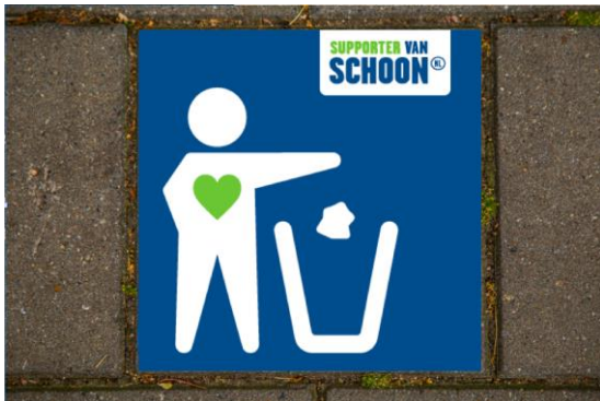
Afbeelding: Supporter van Schoon stoeptegels

De communicatiekracht van Supporter van Schoon wordt versterkt door eenduidige aanstekelijke uitingen en voorzieningen in de openbare ruimte, zoals de Supporter van Schoon stoeptegels met motiverende tekst of opvallende afvalbakken. Lokale Supporter van Schoon initiatieven worden ondersteund door het digitale platform. Via de webshop worden tevens opruimmaterialen en communicatiemiddelen aan Supporters van Schoon beschikbaar gesteld.