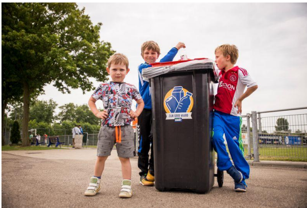
Afbeelding: Schoon Belonen container bij sportclub

Gemeenten die deze aanpak reeds hanteren kunnen uitbreiden naar meer scholen, (sport)clubs of (scouting)verenigingen. Na het pilotproject Schoon Belonen in 2016-2017 zijn ongeveer 70 gemeenten met de Schoon Belonen aanpak doorgegaan. Gemeenten voor wie de aanpak nieuw is kunnen met behulp van de toolkit een snelle start maken. Kennisbijeenkomsten zijn een belangrijk platform waar gemeenten ervaringen kunnen uitwisselen om daarmee hun zwerfafvalaanpak en gescheiden inzameling te optimaliseren. Gedragspsychologen kunnen worden ingeschakeld voor maatwerkadvies om het beloningssysteem in een gemeente te optimaliseren. Stakeholders en deelnemende gemeenten worden regelmatig geïnformeerd en gemotiveerd via een digitale nieuwsbrief, magazine en social media.