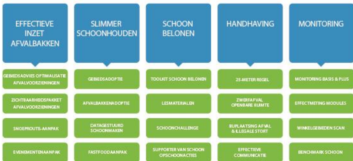
Afbeelding: Overzicht 5 pijlers en 20 modules gemeenteprogramma

Gemeenten kunnen stap voor stap gebruik maken van de modules rekening houdend met de lokale omstandigheden en reeds geïmplementeerde maatregelen.