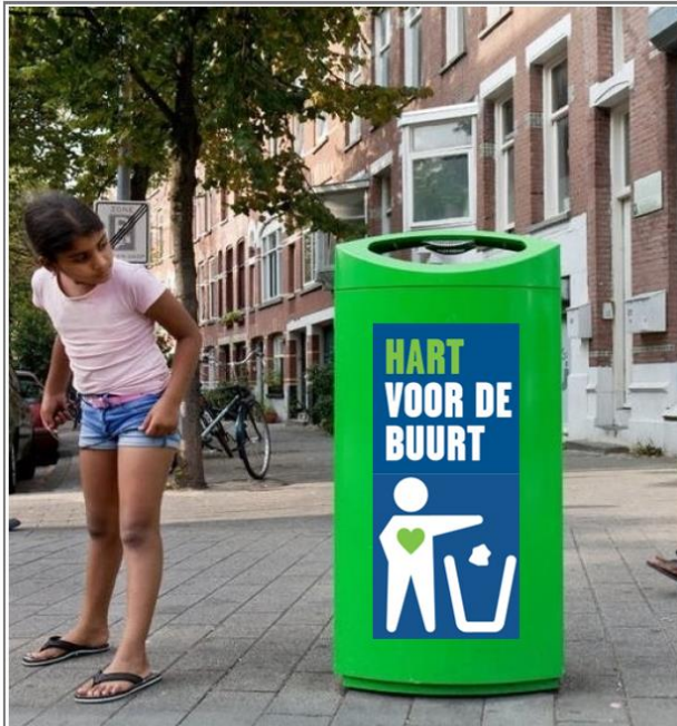
Afbeelding: Locatie met effectieve lichtgroene afvalbak en signing