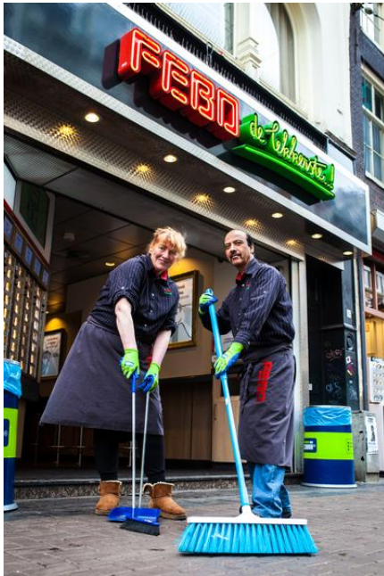
Afbeelding: Gebiedsadoptie: gebied structureel schoonhouden

Gemeenten spelen een belangrijke rol in het ondersteunen en motiveren van inwoners en ondernemers die zich graag inzetten voor een schonere omgeving. NederlandSchoon vat in de pijler Slimmer Schoonhouden een aantal praktische tools en innovatieve technieken samen waarmee een gemeente concreet effect kan bereiken. Met deze methoden kan snel ingespeeld worden op het momentum waarin mensen een bijdrage willen leveren aan een verantwoorde omgang met (zwerf)afval.