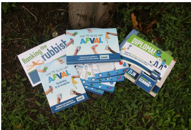
Afbeelding: Lesmaterialen in de afvalkoffer

NederlandSchoon werkt aan samenwerking met organisaties waar grote groepen kinderen samen komen. Zo deed de landelijke kinderopvangorganisatie Partou mee met de Landelijke Opschoondag en zet bijvoorbeeld kinderopvang Humanitas, eveneens een landelijke organisatie, op 250 van haar vestigingen de afvalkoffer voor buitenschoolse opvang in. Deze organisaties hechten groot belang aan duurzaamheid, het bewust omgaan met afval en het zorgen voor een schone omgeving. NederlandSchoon spant zich in vergelijkbare samenwerkingsconcepten op te zetten waardoor zoveel mogelijk jongeren meeprofiteren van zwerfafvaleducatie.