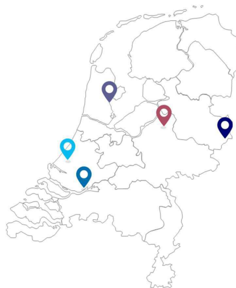
Figuur 0: Ligging van de deelnemende verpleeghuizen

Voor de samenstelling van de casuïstiek is gekozen voor deelname van vijf verpleeghuizen . Deze verpleeghuizen zijn benaderd op basis van hun ligging (regionale spreiding) en bereidheid (capaciteit) om deel te nemen aan het onderzoek. Per verpleeghuis zijn vervolgens vijf recent afgeronde zorgtrajecten geselecteerd voor de samenstelling van de casuïstiek. 2 De selectie van cases vond plaats op basis van verschillende kenmerken, waarbij een voorwaarde was dat er geen afhankelijke relatie meer was met het betreffende huis. Alle onderzochte zorgtrajecten hebben betrekking op een recent vertrek i.v.m. verhuizing of overlijden. Dat houdt in dat in alle tlf cases het zorgtraject afgerond was bij de start van het onderzoek, ca. A weken tot 1€ maanden terug. In de selectie speelde een spreiding in mate van eigen regie (variëteit in leeftijd, geslacht, ziektebeeld, taalbeheersing) een grote rol. In dit onderzoek is geen specifieke variëteit aangebracht in culturele diversiteit van bewoners of personeel.