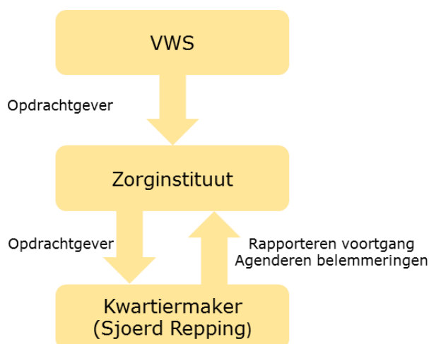
Figuur 4. Opdrachtgeverschap kwartiermaker