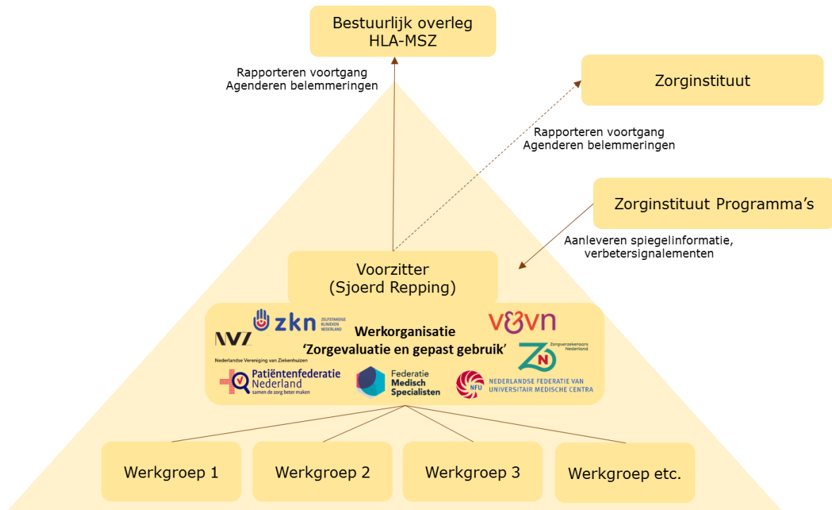
Figuur 5. Governance van het programma 'Zorgevaluatie en gepast gebruik'

proces van agenderen, evalueren en implementeren met alle andere initiatieven bij andere partijen. Het Zorginstituut kan daarnaast te allen tijde om advies of spiegelinformatie worden gevraagd door de werkorganisatie en de werkgroepen.