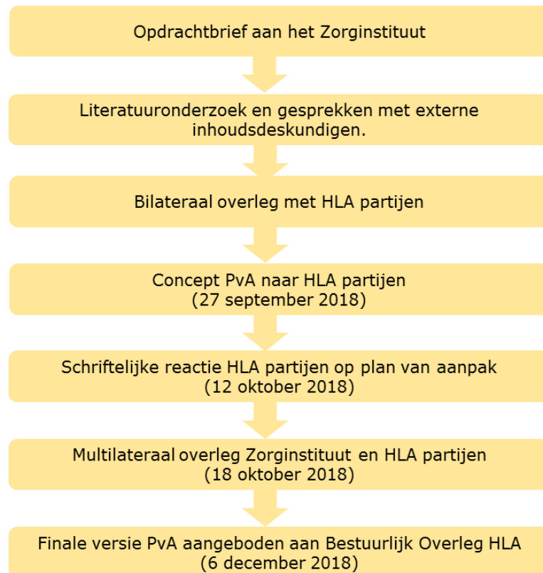
Figuur 1: Tijdslijn voor plan van aanpak

Een concept van dit plan van aanpak is op 27 september 2018 aan de HLA partijen aangeboden ter consultatie van hun bestuur en achterban. In een multilateraal overleg op 18 oktober 2018 is de inhoud in aanwezigheid van alle HLA-partners integraal besproken waarna het plan van aanpak op 19 november is geagendeerd voor het Bureauoverleg HLA-MSZ. Naar aanleiding van de opmerkingen van partijen is het document aangepast. Het plan van aanpak wordt op 6 december 2018 ter besluitvorming geagendeerd voor het Bestuurlijk Overleg HLA-MSZ.