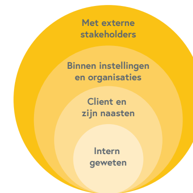
Figuur 3: Verantwoording als dialoog op verschillende niveaus

Het afleggen van verantwoording dicht bij de praktijk dient plaats te vinden op verschillende niveaus (zie figuur). Ten eerste vraagt dit om voortdurende zelfreflectie van professionals . Ten tweede vraagt het op het niveau van de zorgrelatie een dialoog met de patiënt, cliënt en/of mantelzorger . Ten derde vraagt het een dialoog op het niveau van de organisatie, bijvoorbeeld tussen bestuurders en zorgprofessionals, en tussen afdelingen onderling. Ten vierde vraagt het om een dialoog met externe partijen die actief meedenken.