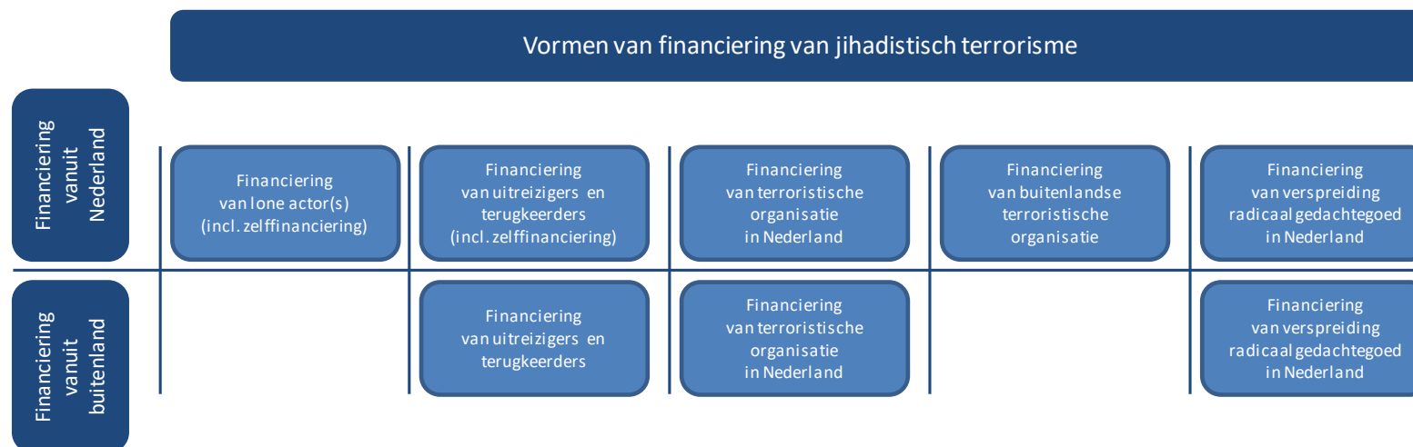
Figuur 2 Vormen van financiering van jihadistisch terrorisme*