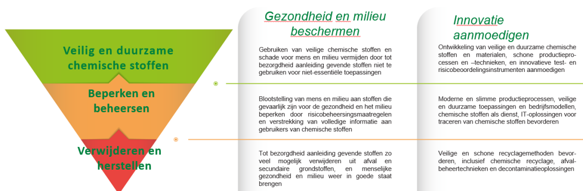
Figuur: De gifvrije hiërarchie — een nieuwe hiërarchie in het beheer van chemische stoffen

met het oog op het aantrekken van investeringen in veilige en duurzame producten en productiemethoden.