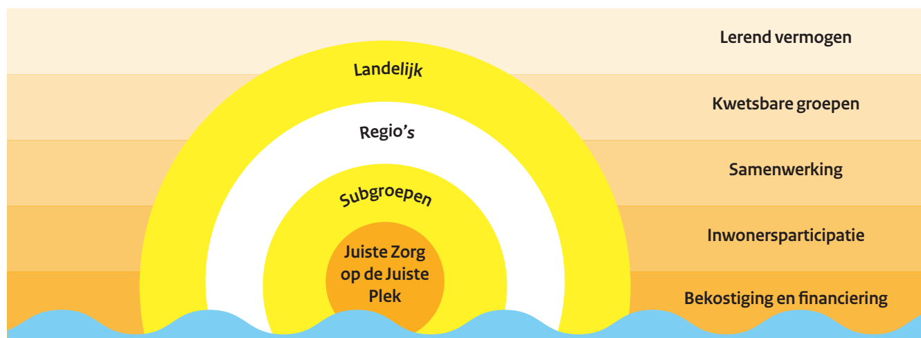
Figuur 2. Inhoudelijke focus lerende evaluatie JZOJP

De deelnemers aan de actietafels willen graag aan de slag met de door hen benoemde ontwikkelvragen . Dit zal in 2021 gebeuren tijdens de actietafels alsook tijdens verdiepende case-studies met de deelnemers aan de actietafels. Zo wordt met de actietafel van de leerregio's gestart met een bijeenkomst in het voorjaar gericht op een domeinoverstijgende verbetercyclus, een tool om als regio de versnellingskansen in de samenwerking te achterhalen, en een businesscase vanuit sociaal en medisch domein. Verder zoomen we in 2021 op drie specifieke subgroepen in: ouderen, mensen met mentale diversiteit en veelgebruikers. Deze activiteiten worden afgestemd en verbonden met andere programma's en initiatieven, zoals de GROZzerdammen (Health Holland, 2020) en het kennisplatform JZOJP. Tevens zullen we met de actietafels en de landelijke tafel aan de slag gaan met de centrale hoofdvraag: 'wat is nodig om de beweging JZOJP verder te brengen?'. Wat is nodig om de beweging JZOJP verder te brengen?