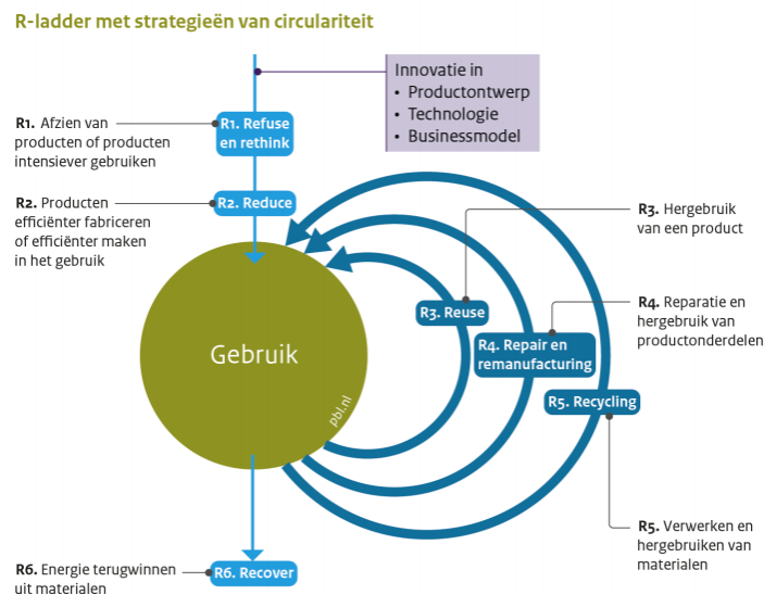
Figuur 2.1 R-ladder met strategieën van circulariteit.

Voor de transitie naar een circulaire economie zijn stappen op alle treden van de R-ladder nodig. In figuur 2.1 is de R-ladder visueel weergegeven waarin de verschillende strategieën worden beschreven. Belangrijke stappen zitten bovenaan de R-ladder (refuse, reduce, re-use), maar ook als het gaat om recycling kan er nog veel bereikt worden. Bij recycling gaat het om het verwerken en opnieuw gebruiken van afvalstoffen nadat zij zijn afgedankt. Zo worden bijvoorbeeld kritieke metalen teruggewonnen uit afgedankte metalen en weer ingezet in nieuwe producten, maar ook oud papier wordt gerecycled tot onder andere nieuw krantenpapier.