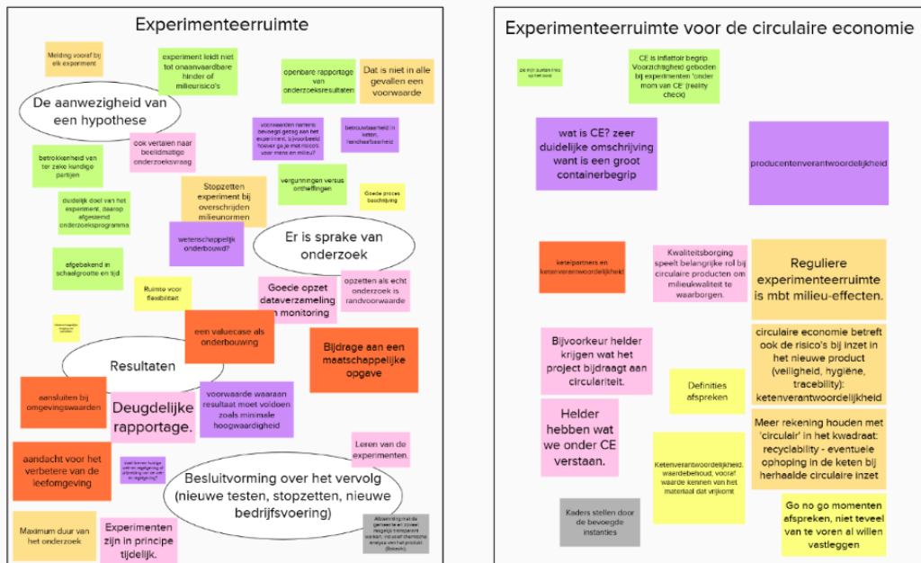
Figuur B1.1 Brainstorm definitie experimenteerimte in Mural