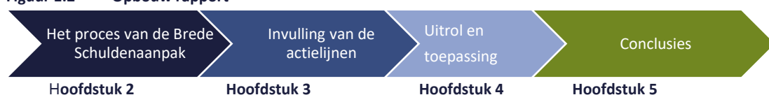
Figuur 1.2 Opbouw rapport

In de komende hoofdstukken worden de uitkomsten van deze evaluatie gepresenteerd. Hierbij is in hoofdstuk 2 allereerst aandacht voor het proces van de Brede Schuldenaanpak door te kijken naar de keuzes voor de verschillende actielijnen en thema's en hoe deze gewaardeerd worden door de verschillende soorten respondenten. Vervolgens komen ook de verschillende ervaringen met de invulling van het SBS aan bod. Hoofdstuk 3 focust zich in aansluiting daarop op (de ervaringen met) de invulling van deze actielijnen en de activiteiten en maatregelen per actielijn. In hoofdstuk 4 komen (ervaringen met) de toepassing en uitrol van de maatregelen bij gemeenten en uitvoeringsorganisaties aan bod. Ten slotte bevat hoofdstuk 5 de samenvattende conclusies.