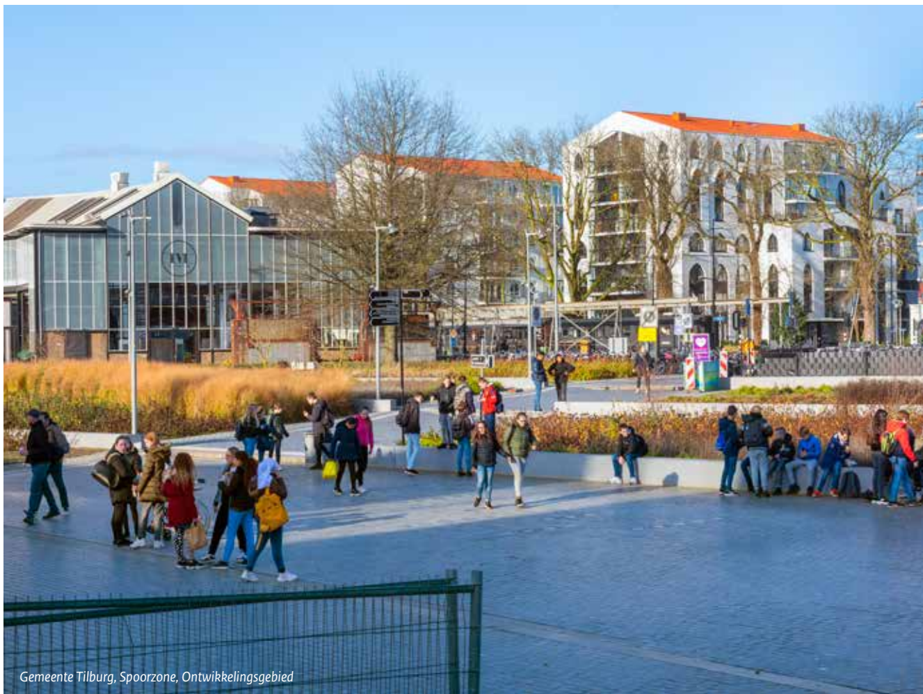
Gemeente Tilburg, Spoorzone, Ontwikkelingsgebied