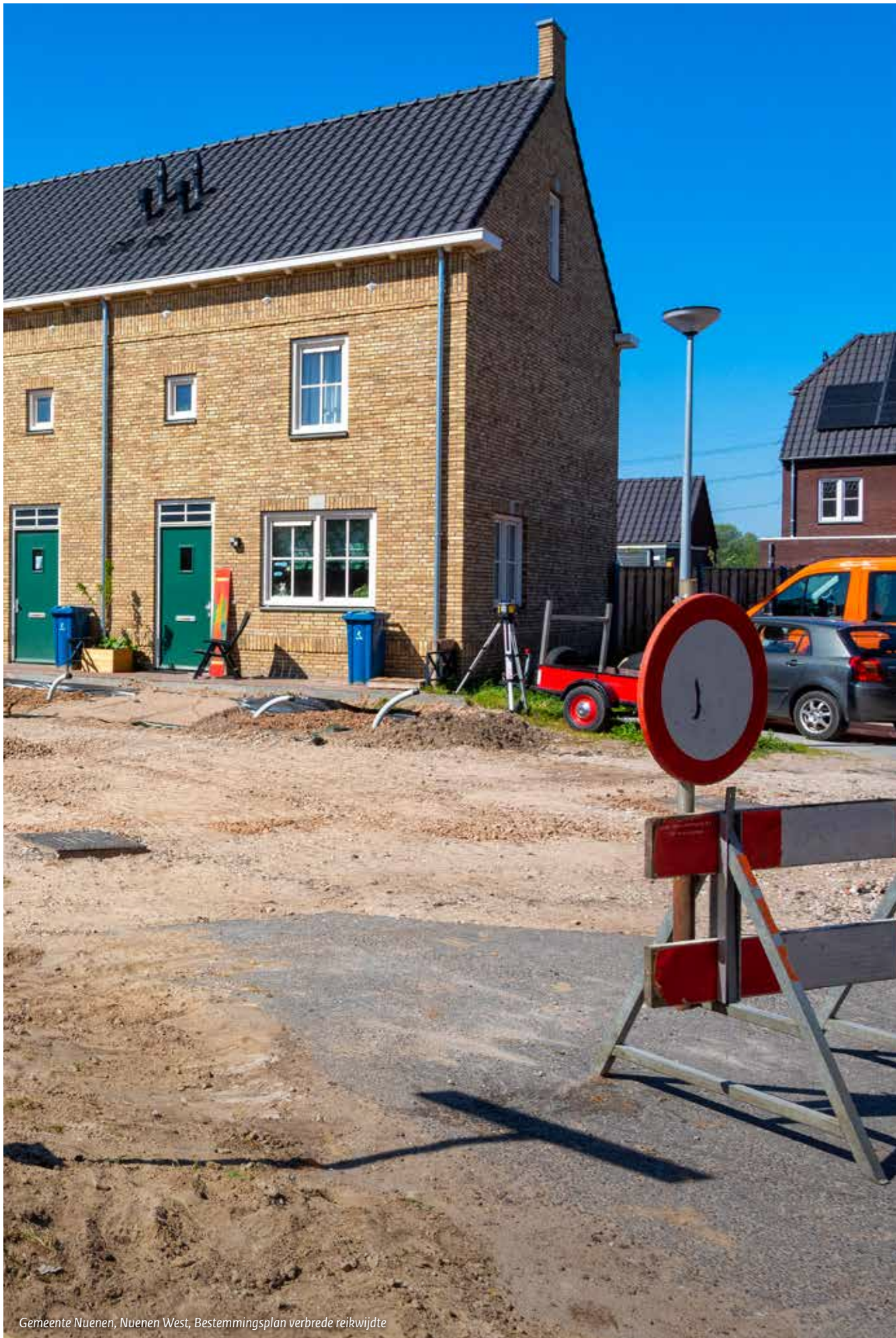
Gemeente Nuenen, Nuenen West, Bestemmingsplan verbrede reikwijdte