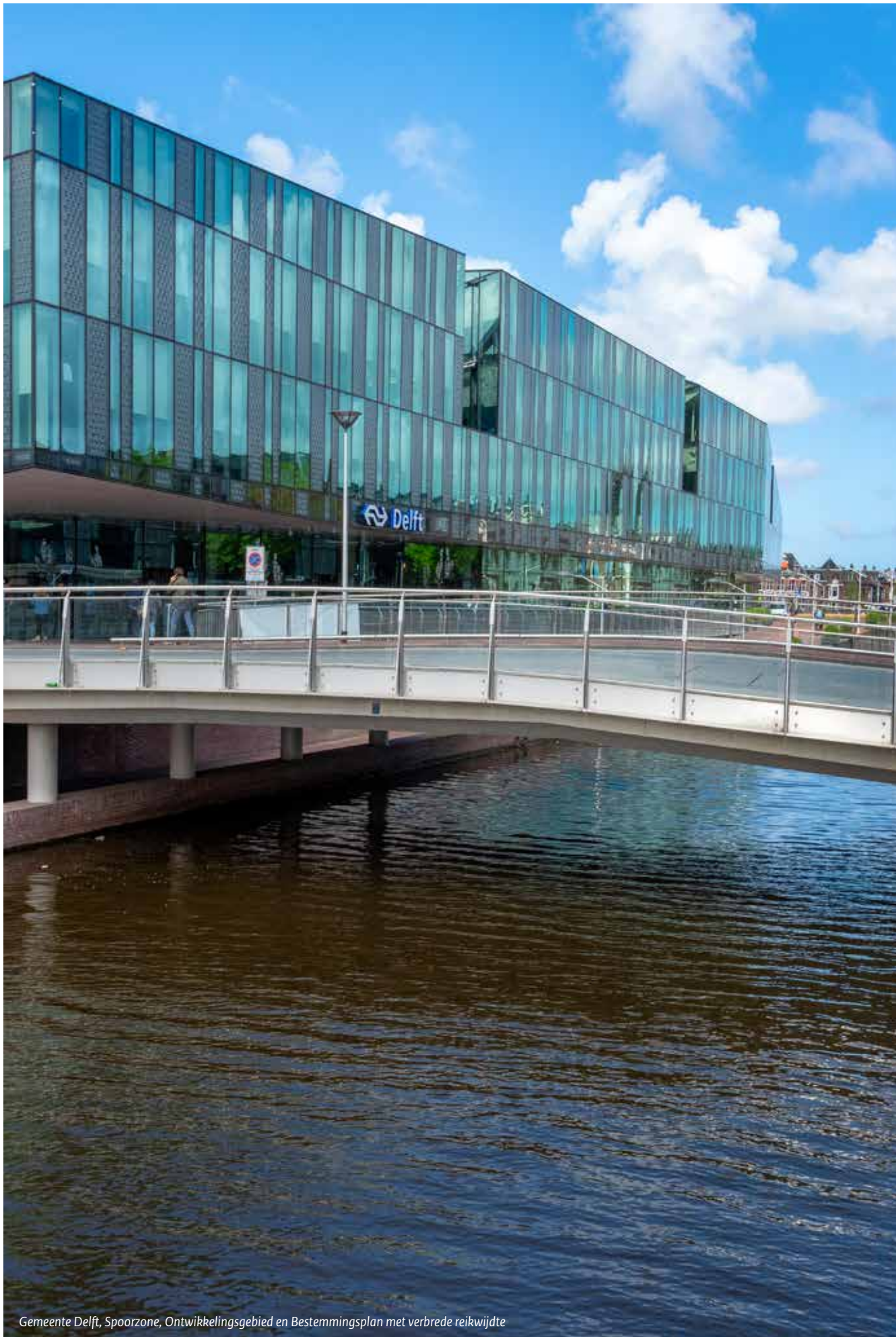
Gemeente Delft, Spoorzone, Ontwikkelingsgebied en Bestemmingsplan met verbrede reikwijdte