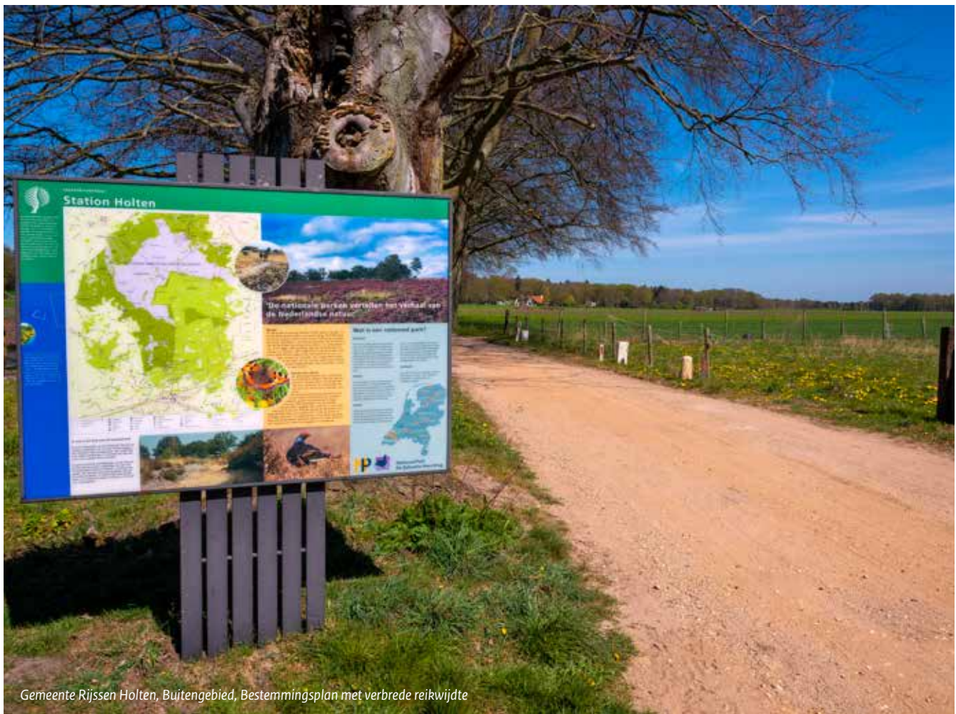
Gemeente Rijssen Holten, Buitengebied, Bestemmingsplan met verbrede reikwijdte

Toch borrelen ook op het digitale vlak nog veel ideeën op. Wat zou het mooi zijn om de werkelijkheid met een drie dimensionale weergave nog beter te benaderen (een wens die vooral speelt bij het nog op te stellen omgevingsplan Kernen) of om de milieuregels in de vorm van zoneringen op kaart te zetten. Het is ideaal als iedereen met een eenvoudige ‘klik’ op de kaart kan zien wat op die locatie wel of niet mogelijk is en aan welke randvoorwaarden moet worden voldaan. Of helemaal klantvriendelijk: een eigen plan inlezen en dan een eerste toets terugkrijgen of dat plan mogelijk is.