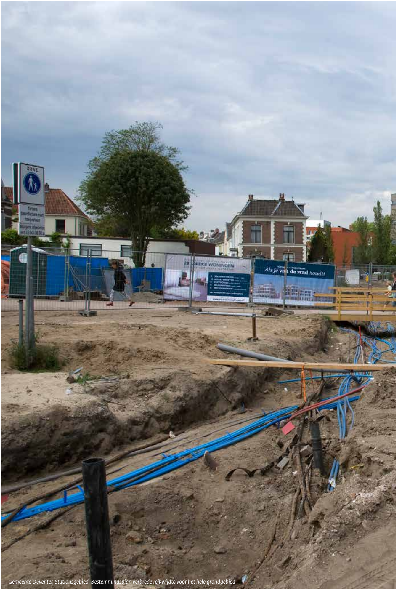
Gemeente Deventer, Stationsgebied, Bestemmingsplan verbrede reikwijdte voor het hele grondgebied