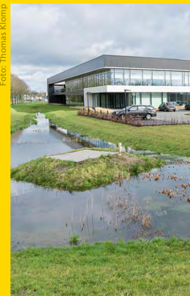
Wadi op bedrijventerrein

Download de hele infographic Groenblauwe bedrijventerreinen: Hoe betrokken partijen bij elkaar komen