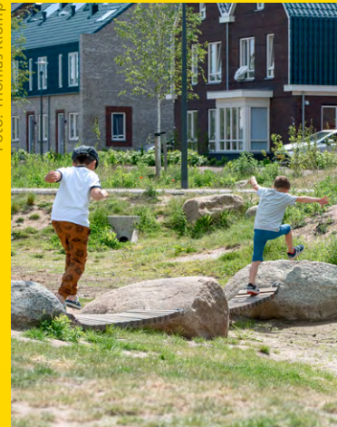
Groene, speelbare waterberging in Nijkerk