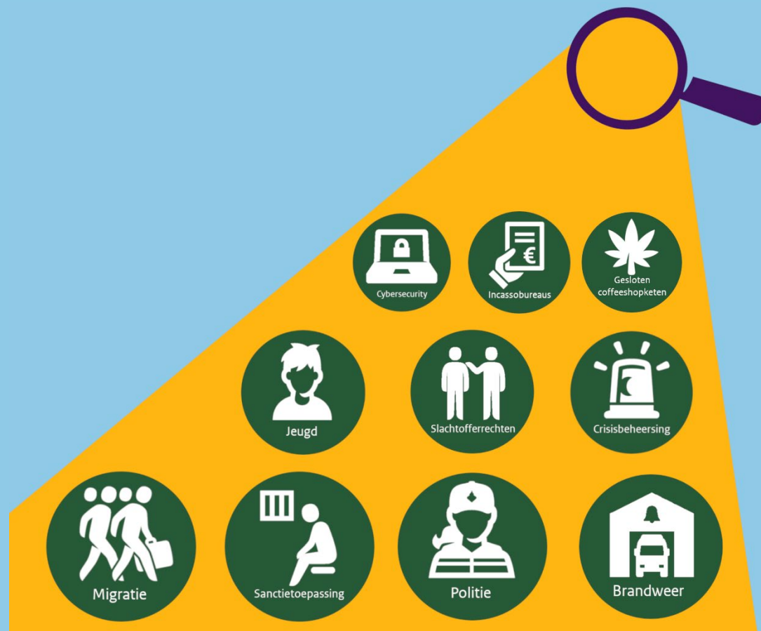
Afbeelding: toezichtgebieden IJenV