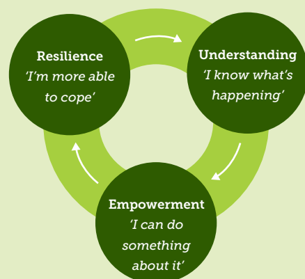
Figuur 2: Virtuous circle of parental empowerment (ontleend aan Shuker, 2017)

Uit het evaluatieonderzoek van Shucker en Ackerly (2017) naar aanleiding van het inzetten van een PLO in de gezinnen, blijkt de meerwaarde van de PLO voornamelijk te zitten op drie dimensies: (i) 'Understanding', (ii) 'Empowerment' en (iii) 'Resilience'. Daarbij lijkt de een de ander te versterken, wat een positieve spiraal van gebeurtenissen in gang zet. Deze drie dimensies worden hierna verder uiteengezet op basis van het werk van eerdergenoemde auteurs (2017). Zie figuur 2 voor een visuele weergave van het model.