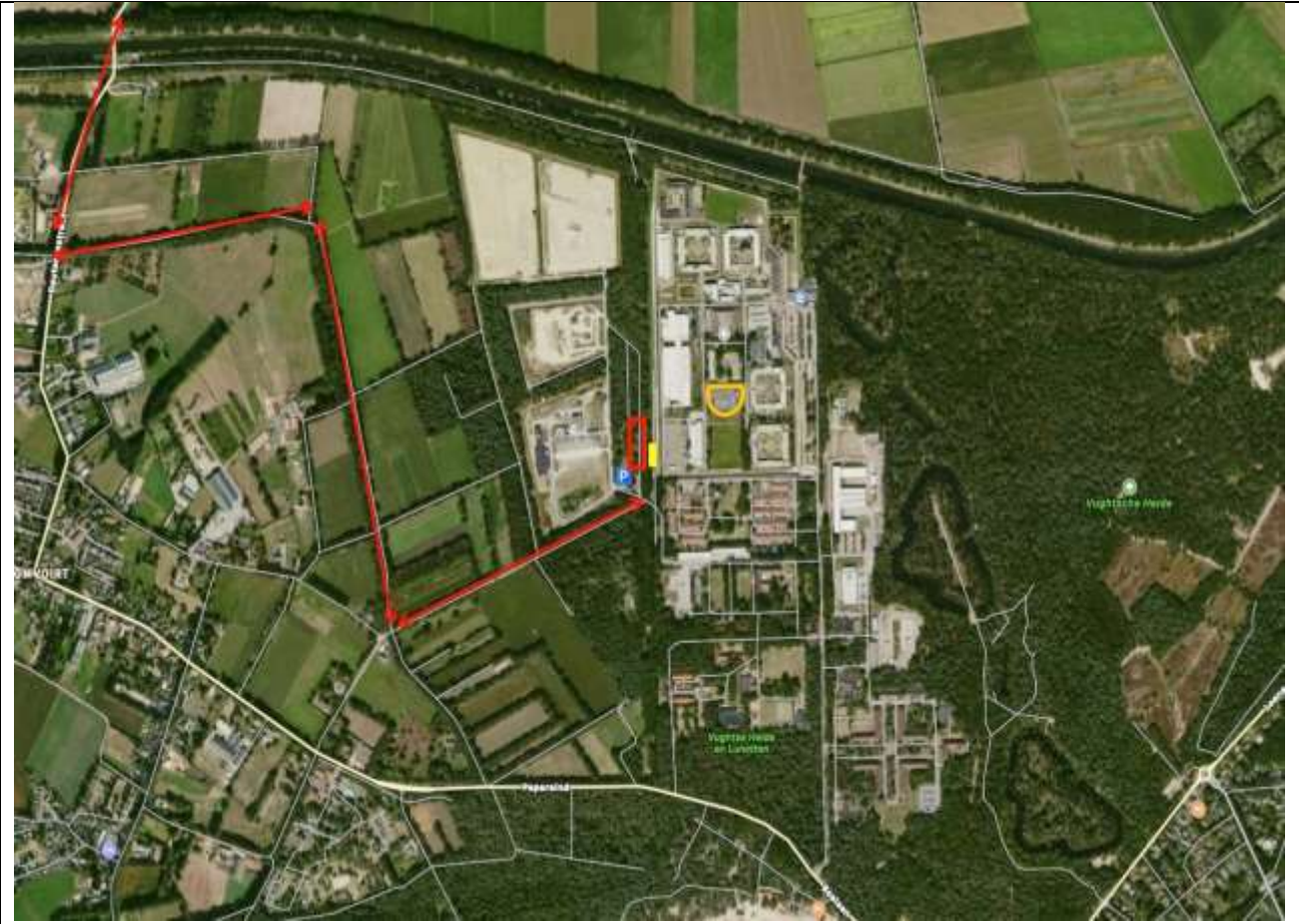
Route 2 e ontsluitingsweg ten Zuidwesten van PI Vught