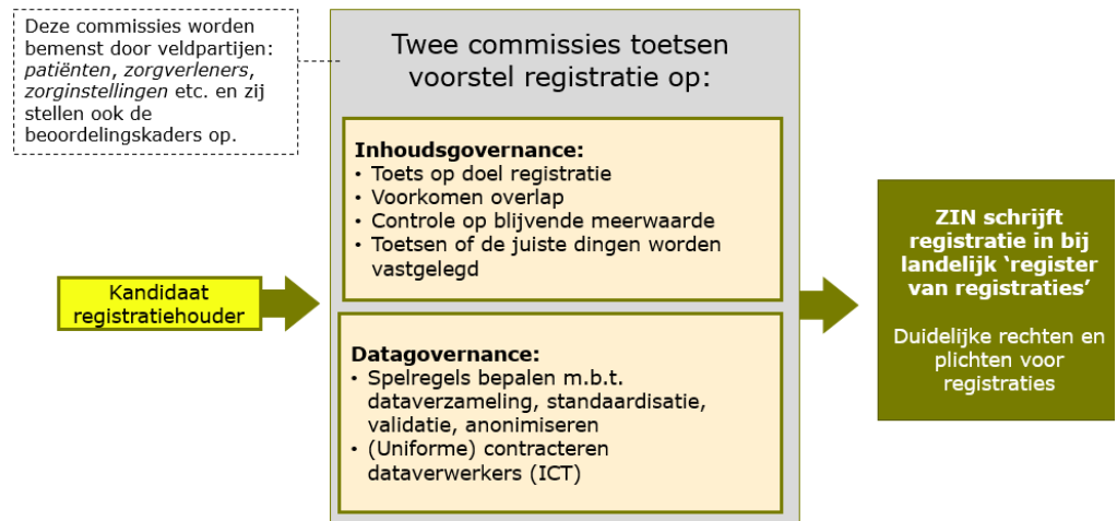
Afbeelding 3: governancestructuur