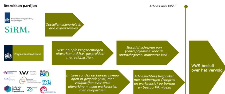
Afbeelding 1: Proces ROR DGM Governance & Financiering tot nu toe

In onderstaand afbeelding wordt het proces tot nu toe weergegeven (afbeelding 1). Tijdens het opstellen van het advies is het projectteam zowel bilateraal als collectief in gesprek gegaan met: de opdrachtgever, de kwartiermaker en het projectteam van het project Governance van Kwaliteitsregistraties en de bureaumedewerkers en besturen van de belangrijkste stakeholders 2 . Door middel van deze gesprekken is het advies opgesteld en verder aangescherpt. De gesprekken die gevoerd zijn, waren gericht op onderling begrip, informatie-uitwisseling en het open gesprek, zodat iedereen zijn rol en verantwoordelijkheid kan nemen in het proces en richting de toekomst. De stappen in het kader van de totstandkoming van dit advies maken geen onderdeel uit van een formele consultatieronde.