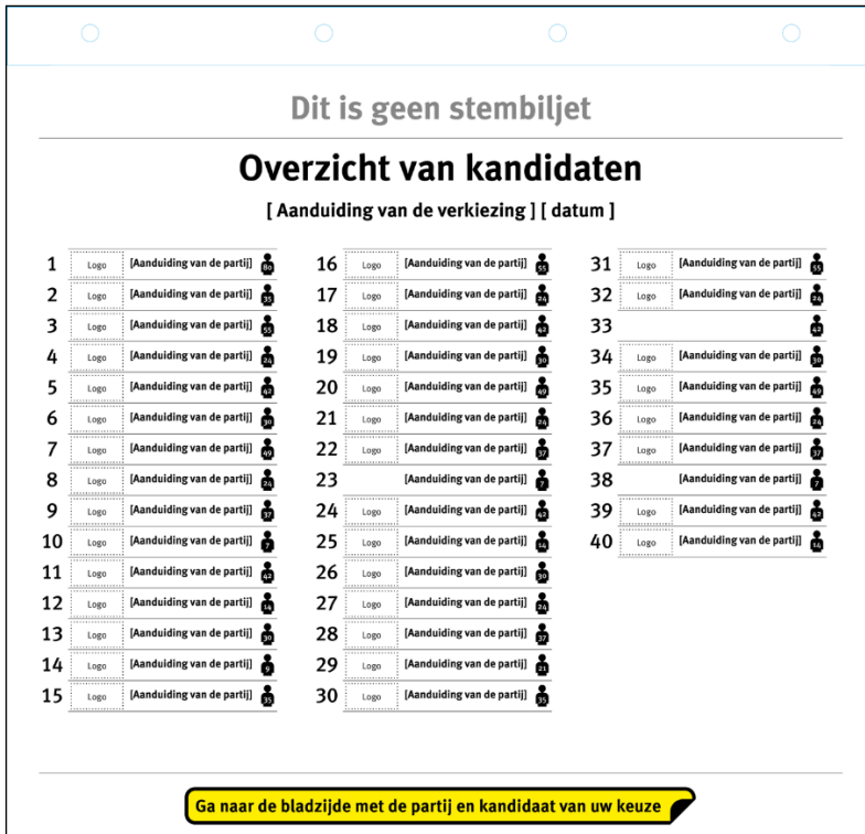
Schets van voorzijde van het overzicht van kandidaten (bij model 2)