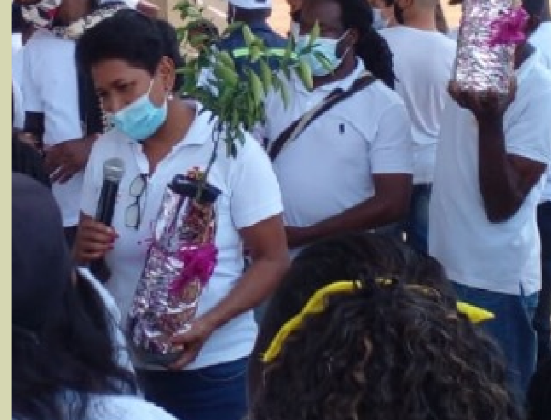
Deelname van partnerorganisatie aan een herdenkingsceremonie in het dorp Munchique, Colombia (2021)

In Colombia biedt Nederland financiële ondersteuning aan de Colombian Commission of Jurists (CCJ). De CCJ is een mensenrechtenorganisatie die bijdraagt aan de verbetering van veiligheids- en beschermingsmechanismen voor Colombiaanse mensenrechtenverdedigers (MRV's). Dit doen zij middels strategieontwikkeling voor procesvoering gericht op de bescherming en verdediging van land van boeren, inheemse volkeren en afro-gemeenschappen. Ook zorgt de organisatie voor meer zichtbaarheid van MRV's en sociale leiders op lokaal, nationaal en internationaal niveau en bevordert de CCJ de deelname van het maatschappelijk middenveld aan lokale en nationale instellingen die betrekking hebben op gerechtelijke vervolging, onderzoek naar en bestraffing van ernstige schendingen van MRV's. Zodoende draagt de organisatie bij aan versterking van de stem van MRV's in besluitvormingsprocessen van de Colombiaanse overheid en verbetering van het Colombiaanse rechtssysteem. Dit is van belang voor het tegengaan van mensenrechtenschendingen door bedrijfsactiviteiten.