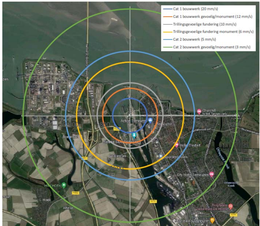
Figuur 12 Effectafstanden (inclusief marge ter compensatie van het omringende water) voor Cat 1 en Cat 2 bouwwerken en Trillingsgevoelige fundering conform [SBR A, 2017], op basis van 5 ms vertraging tussen explosieve ladingen en 500 ms vertraging tussen Middenhoofd en Kolk.