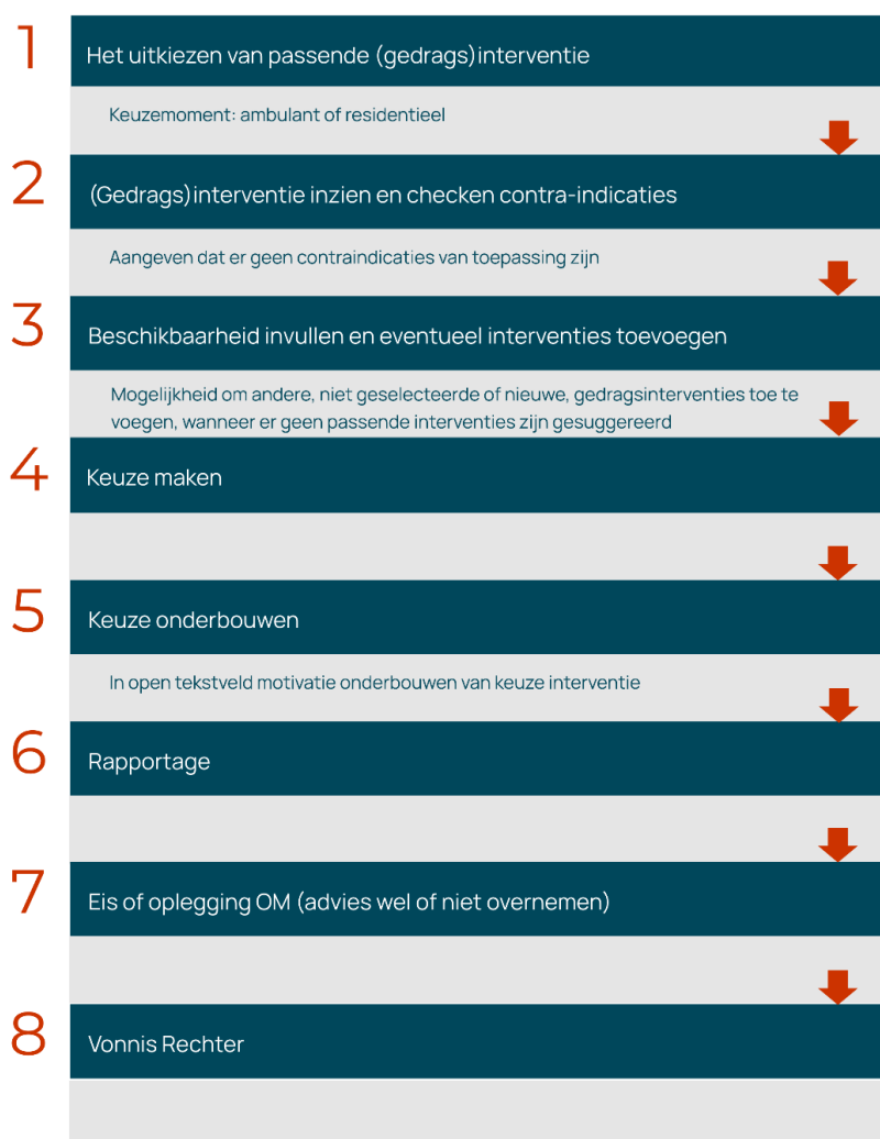
Figuur 1.3 Stappen in het proces van LIJ suggestie voor tot opleggen van een gedragsinterventie

In de handleiding van het LIJ is aangegeven dat na het invullen van de Ritax B het ARR, het DRP en de risicoscores op de domeinen bekend zijn. Dan is de vraag aan de orde of de jongere in aanmerking komt voor één of meerdere gedragsinterventies, vormen van (jeugd)reclasseringstoezicht en/of de gedragsbeïnvloedende maatregel. Zoals eerder gezegd maakt het LIJ een match tussen de jongere en de inclusiecriteria van de (gedrags)interventies. De raadsadviseur checkt vervolgens op eventuele contra-indicaties. Hieronder worden de stappen van de systematiek toegelicht zoals die beschreven zijn in de handleiding van het LIJ. In figuur 1.3 hieronder geven we een schematische weergave van de stappen.