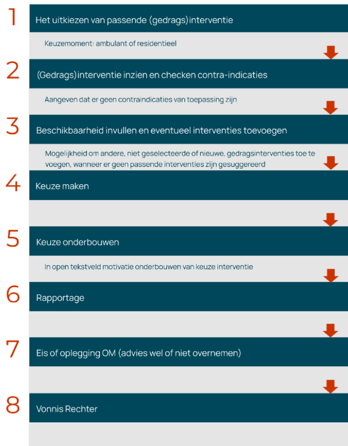
Figuur 1 Stappen in het proces van LIJ tot aan het opleggen van een gedragsinterventie

Om tot een passend advies te komen op basis van de suggesties van het LIJ doorloopt de raadsonderzoeker een zestal stappen die in de onderstaande figuur worden samengevat. In stap 7 neemt de officier van justitie het advies van de RvdK al dan niet over en in stap 8 volgt de rechter al dan niet de vordering van het OM.