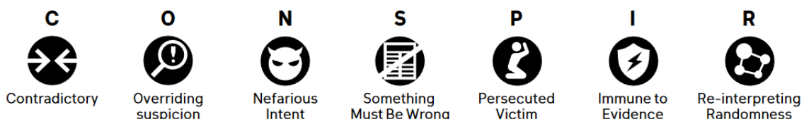
Figuur 2: – CONSPIR, een acroniem voor zeven indicatoren van complotdenken (Lewandowsky & Cook, 2020).

Volgens Lewandowsky en Cook (2020) wordt complotdenken gekenmerkt door (de termen zijn vanuit het Engels vertaald): 1) vasthouden aan ideeën die tegenstrijdig zijn; 2) sceptisch en achterdochtig blijven jegens feiten en alternatieve hypothesen; 3) uitgaan van kwade intenties bij de vermeende samenzweerders; 4) vasthouden aan de overheersende conclusie dat er iets mis is en dat het officiële verhaal een leugen moet zijn; 5) zelfbeeld en presentatie als slachtoffers van georganiseerde vervolging en tegelijkertijd zichzelf zien als moedige antihelden die het opnemen tegen kwaadaardige samenzweerders; 6) immuun zijn voor objectieve feiten; 7) toeval bestaat niet, iedere aanleiding wordt aangegrepen en uitvergroot om nog meer in de complotmythe te gaan geloven (Lewandowsky & Cook, 2020) (zie figuur 2).