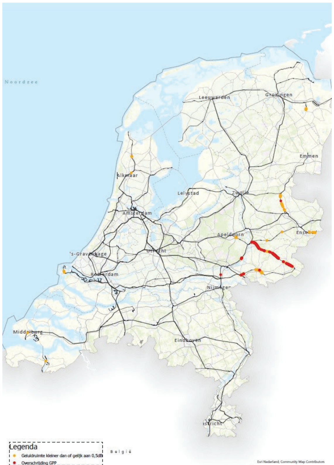
Figuur 1: Landelijk beeld van gpp-overschrijdingen en baanvakken met een krappe geluidruimte