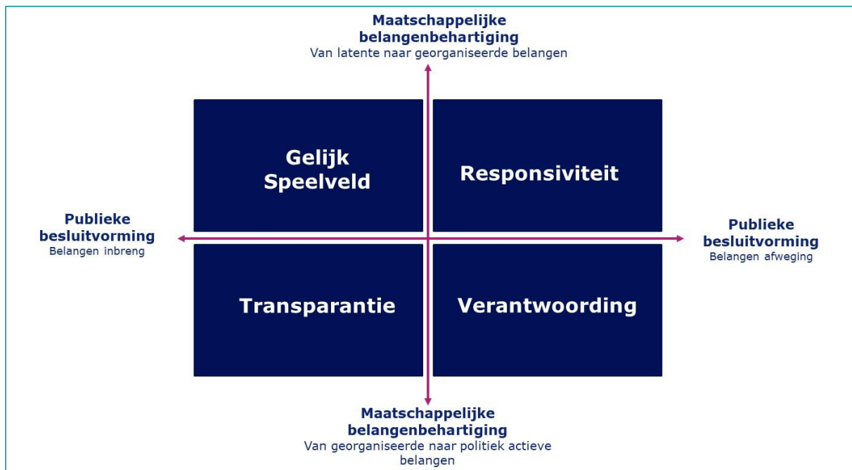
Figuur 3.1: Afwegingskader Legitieme Belangenvertegenwoordiging

Met het Afwegingskader Legitieme Belangenvertegenwoordiging laat we zien dat een expliciete keuze voor specifieke doelstellingen voor wet- en regelgeving of beleidsinstrumentarium noodzakelijk is, omdat elke doelstelling verbonden is met andere (accenten in) regelgeving en instrumentarium.