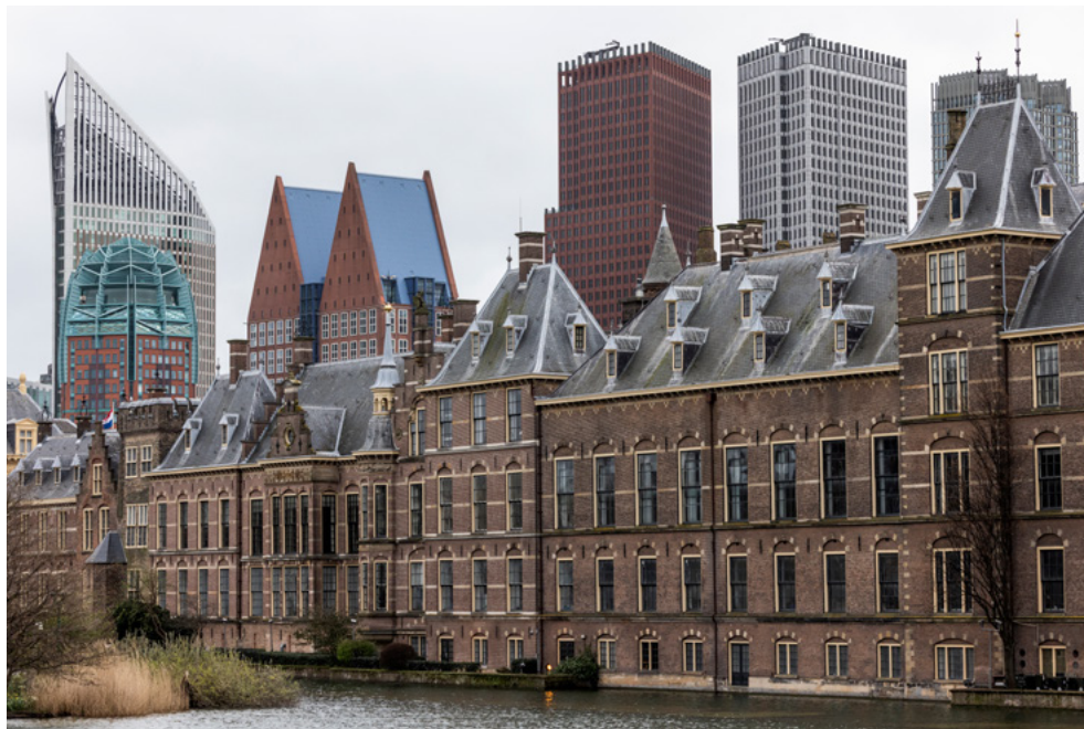
Foto 1. Stadsbeeld van Den Haag met de Hofvijver en diverse ministeries.

In dit hoofdstuk beschrijven we de Nederlandse 'brede benadering' van de democratische rechtsorde. 7 Wat dit betekent, volgt in hoofdstuk 1.1. Kennis over de waarde van de democratische rechtsorde en over hoe deze werkt is noodzakelijk. Dit draagt bij aan het creëren van draagvlak bij iedereen die in de democratische rechtsorde leeft. Dit vergroot mogelijk ook de wil vanuit de samenleving om actief weerstand te bieden als deze bedreigd wordt. Vooral voor instituten zoals de AIVD, die de taak hebben om de democratische rechtsorde te beschermen, is kennis over de democratische rechtsorde heel belangrijk om mogelijke dreigingen waar te nemen en te beoordelen. De AIVD heeft daarom een beoordelingskader opgesteld waarmee niet-gewelddadige, extremistische dreigingen geanalyseerd kunnen worden. Dit kader lichten we toe aan het einde van dit hoofdstuk.