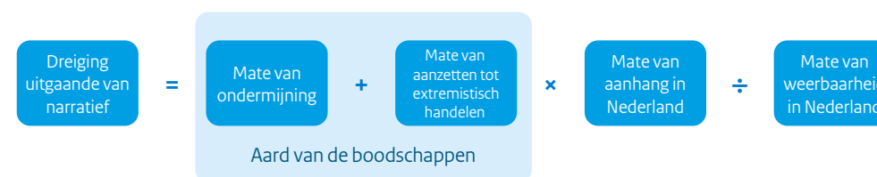
Figuur 2. Beoordelingskader om de dreiging in te schatten die voortkomt uit de verspreiding van extremistische narratieven

De AIVD onderzoekt vier verschillende types niet-gewelddadige extremistische bewegingen die primair vanwege de verspreiding van extremistisch gedachtegoed een dreiging vormen voor de democratische rechtsorde. Dit zijn het anti-institutioneel-extremisme, links-extremisme, rechts-extremisme, en islamitisch extremisme. Voor al deze bewegingen gebruikt de AIVD hetzelfde beoordelingskader om de dreiging in te schatten die voortkomt uit de verspreiding van extremistische narratieven. Zie figuur 2. De uiteindelijke conclusie is niet het antwoord op een rekensom zoals het figuur doet vermoeden, maar is de combinatie van kwalitatieve inschattingen die op basis van beschikbare inlichtingen worden gemaakt.