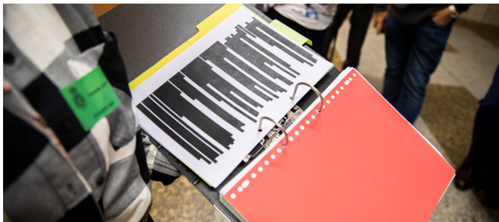
Foto 6. Een gedupeerde van de toeslagenaffaire laat een zwartgelakt dossier zien.

Ondanks de conclusie dat het narratief over een 'kwaadaardige elite' waarschijnlijk op lange termijn een ernstige dreiging vormt voor de democratische rechtsorde, is er door de aard van het narratief en de gevolgen hiervan slechts deels sprake van een zaak waar politie of justitie iets mee kunnen. Vrijheid van meningsuiting en persvrijheid spelen hier ook een belangrijke rol in. Strafrechtelijk ingrijpen is daarom lang niet altijd mogelijk en kan juist het narratief, en de dreiging die ervan uitgaat, versterken. Dit maakt dat de weerbaarheid in de samenleving tegen dit narratief des te belangrijker is. Het is belangrijk dat de samenleving het narratief herkent en onderkent dat het feitelijk onjuist is.