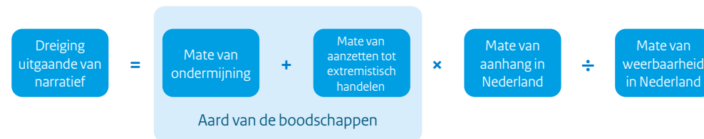
Figuur 3. Beoordelingskader om de dreiging in te schatten die voortkomt uit de verspreiding van extremistische narratieven

In dit hoofdstuk lichten we toe hoe de AIVD de dreiging van het anti-institutioneel-extremisme beoordeelt. De conclusie volgt uit de stappen uit het beoordelingskader dat we in hoofdstuk 1 introduceerden. Hierbij kijken we eerst naar de aard van de boodschappen om de ernst van de ondermijning te bepalen (in de verticale en horizontale dimensie) en om te beoordelen in hoeverre ze aanzetten tot extremistisch handelen. Daarna beschrijven we de mate van aanhang en de mate van weerbaarheid.