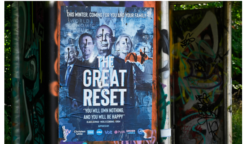
Foto 5. Een in Limburg opgehangen poster waarop de indruk wordt gewekt dat Mark Rutte, Sigrid Kaag, Bill Gates, Klaus Schwab en George Soros door hun hoofd zijn geschoten.

Tot nu toe is het aantal gewelddadige uitwassen van het narratief over een 'kwaadaardige elite' beperkt. Doordat aanjagers over het algemeen juist een geweldloos verzet verkondigen en het oproepen tot geweld veroordelen, acht de AIVD het ook twijfelachtig dat het narratief door veel aanhangers aangegrepen zal worden om extremistisch geweld te plegen. Het ontbreken van een eenduidige strategie of beeld van hoe de nieuwe situatie eruit zou moeten zien, maakt de beweging waarschijnlijk ook minder slagvaardig. Tegelijkertijd maakt deze onvoorspelbare eindsituatie de dreiging ook minder voorspelbaar. De AIVD heeft hierin een opdracht om de mogelijk wijzigende (gewelds)dreiging van het narratief over een 'kwaadaardige elite' en eensgezindheid onder aanhangers te onderzoeken.