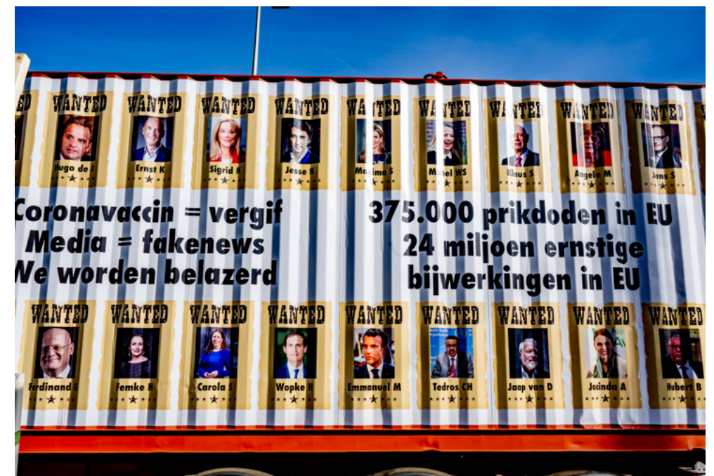
Foto 2. Grote poster met de oproep om in opstand te komen tegen de coronamaatregelen, gebruikt bij een protest in Den Haag. Er staan vooraanstaande personen op afgebeeld die deel zouden uitmaken van de 'kwaadaardige elite'.

Een deel van deze beweging is bovendien door de tijd heen van activistisch geradicaliseerd naar extremistisch. In eerste instantie richtte men zich tegen het coronabeleid, later kwamen daar andere thema's bij. Verschillende onderwerpen die raken aan latente zorgen die mensen al hadden over de overheid en instituties, werden opgenomen in bestaande boodschappen. Deze boodschappen werden via sociale media razendsnel verspreid. Voor een deel van deze beweging bood het narratief over een 'kwaadaardige elite' een verklaring voor alle zorgen en tegenspoed die werden ervaren, en vanuit daar is dit gedachtegoed steeds dominantier geworden. De groep die is blijven geloven in dit narratief over een 'kwaadaardige elite' is verworpen tot de anti-institutioneel-extremistische beweging.