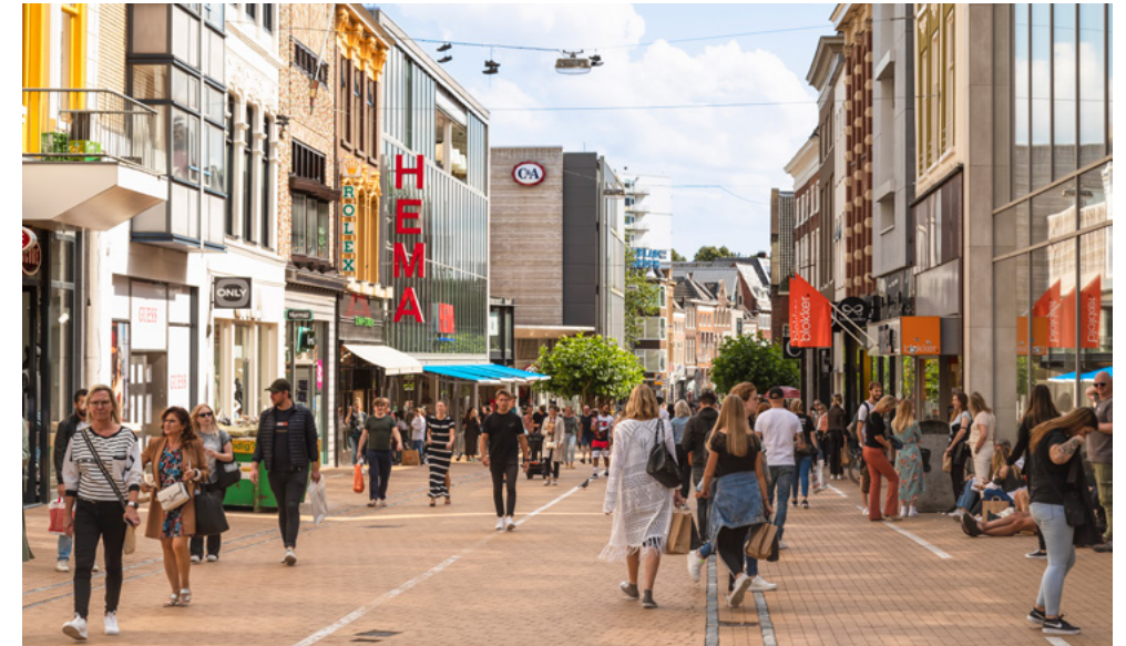
Foto 4. Winkelend publiek in de binnenstad van Groningen.

Hoewel veel aanhangers van het narratief waarschijnlijk niet bekend zijn met deze oorsprong, kunnen rechts-extremisten hier aanknopingspunten in zien om het antisemitische aspect meer te belichten. Op dit moment heeft de AIVD echter geen aanwijzingen dat er door de bredere anti-institutionele groep vijandbeelden geprojecteerd worden op andersdenkenden.