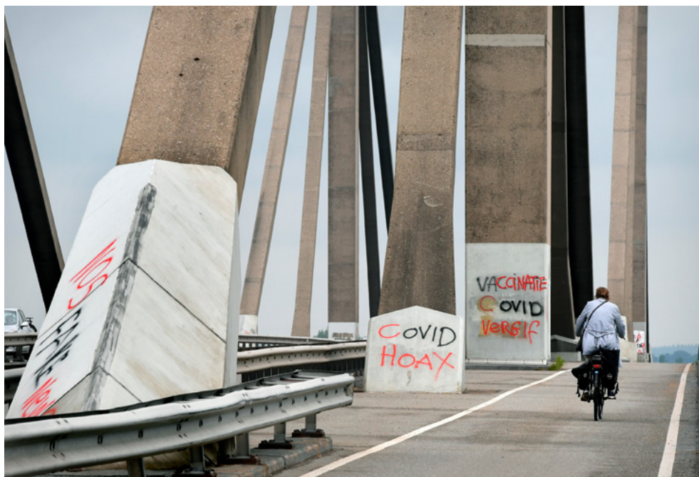
Foto 3. Een voorbijganger op de Prins W Ilem-Alexanderbrug over de Waal fietst langs graffiti-leuzen die het coronavirus en de betrouwbaarheid van traditionele nieuwsmedia in twijfel trekken.

Naast de focus op de overheid in zijn geheel, heeft het narratief over een 'kwaadaardige elite' aandacht voor afzonderlijke instituties.