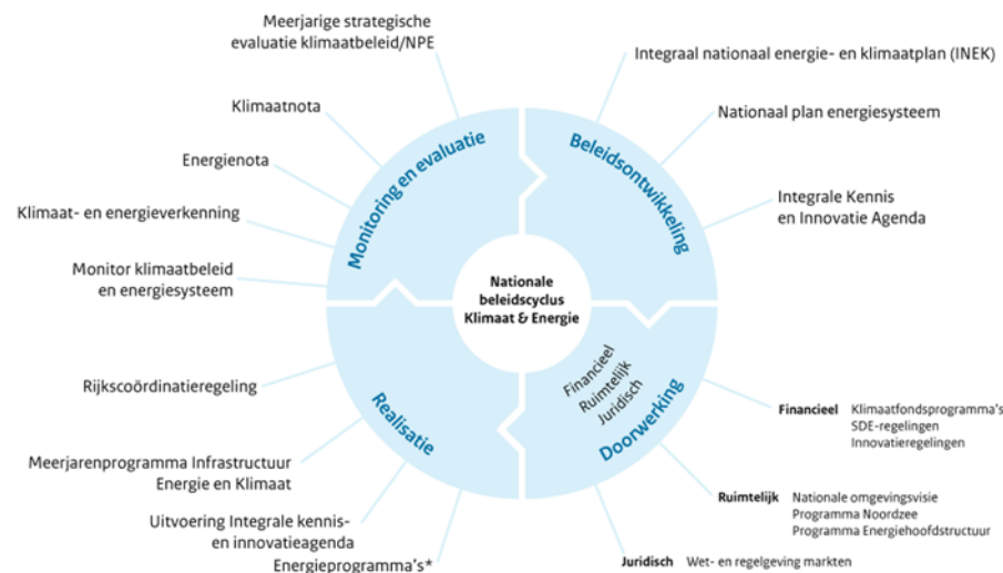
Hoe ziet de nationale beleidscyclus van klimaat en energie eruit en welke hoofdproducten horen hierbij?

Het NPE verschijnt in een cyclisch proces ten minste elke vijf jaar, gekoppeld aan de cyclus van het Klimaatplan. In lijn met het Klimaatplan, vormt het NPE ook de basis voor het 'energiedeel' van het Integraal Nationaal Energie- en Klimaatplan (INEK). Het NPE werkt als kaderstellend document door in juridische, financiële en ruimtelijke beleidsinstrumenten, zoals hieronder is weergegeven in Figuur 2. Binnen de uitvoeringsgerichte programma's zoals het Meerjarenprogramma Infrastructuur Energie & Klimaat (MIEK), worden projecten inhoudelijk getoetst aan het NPE.