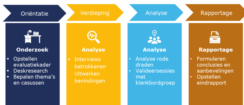
Figuur 1: Het door ons doorlopen onderzoeksproces

Daarnaast hebben we in meerdere sessies met de klankbordgroep (provincies, IenW, sectorpartijen) onze bevindingen gevalideerd en aangevuld en hebben wij er lessen uit getrokken. Een stuurgroep (provincies, IenW) heeft nauwlettend de koers van de evaluatie gevolgd. Tot slot hebben we een gesprek gehad met een vertegenwoordiger van de Nederlandse Vereniging van Luchthavens (NVL) om het NVL-perspectief op de conceptrapportage op te halen.