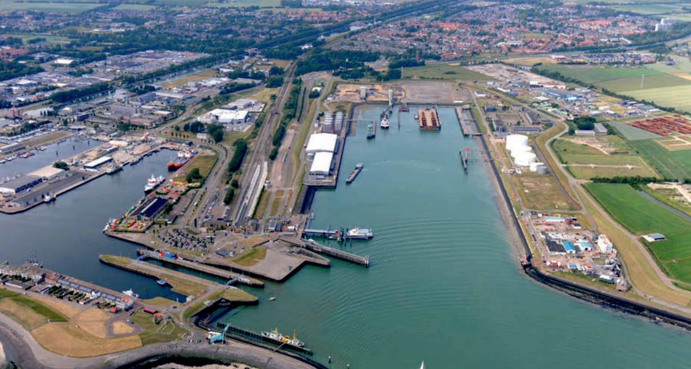
Fiche G: Industrie en haven (afgerond)