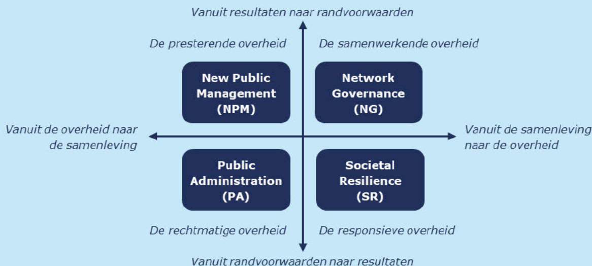
Figuur 2. Het NSOB-model voor overheidssturing.

De horizontale as gaat over sturing; aan de linkerkant van de as stuurt de overheid met name, door het maken van beleid en wet- en regelgeving. Aan de rechterkant van de as komen er met name plannen en initiatieven vanuit de samenleving, zoals bedrijven, maatschappelijke partijen en burgers. De rol van de overheid is getypeerd als de rechtmatige, presterende, samenwerkende en responsieve overheid .