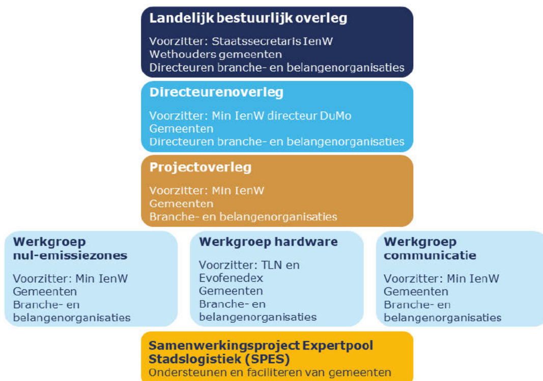
Figuur 1. Organisatie van de UAS