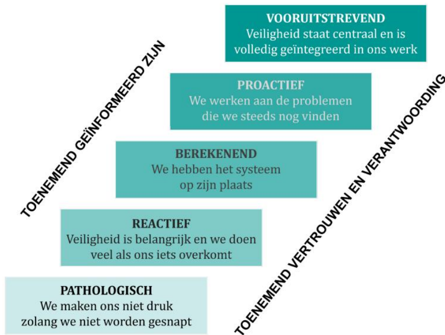
Figuur 3 – De Safety Culture Ladder 2.0: 2023 (NEN).

Het model maakt gebruik van vijf treden, die elk een niveau van veiligheidsbewustzijn vertegenwoordigen. Hoe hoger een organisatie op de ladder staat, hoe beter het is gesteld met de veiligheidscultuur. De definitie van de treden is vergelijkbaar met de modellen van overheid en SURF.