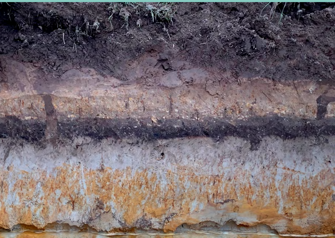
Foto: Bodemprofiel bij een archeologische opgraving in Haps.