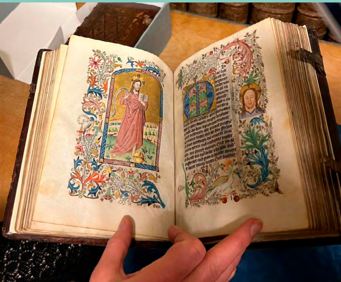
Foto: Boek uit Rijkcollectie Bibliotheca Philosophica Hermetica in Amsterdam.