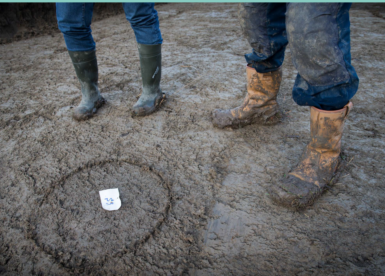
Foto: Ingekrast bodemspoor met spoornummer.