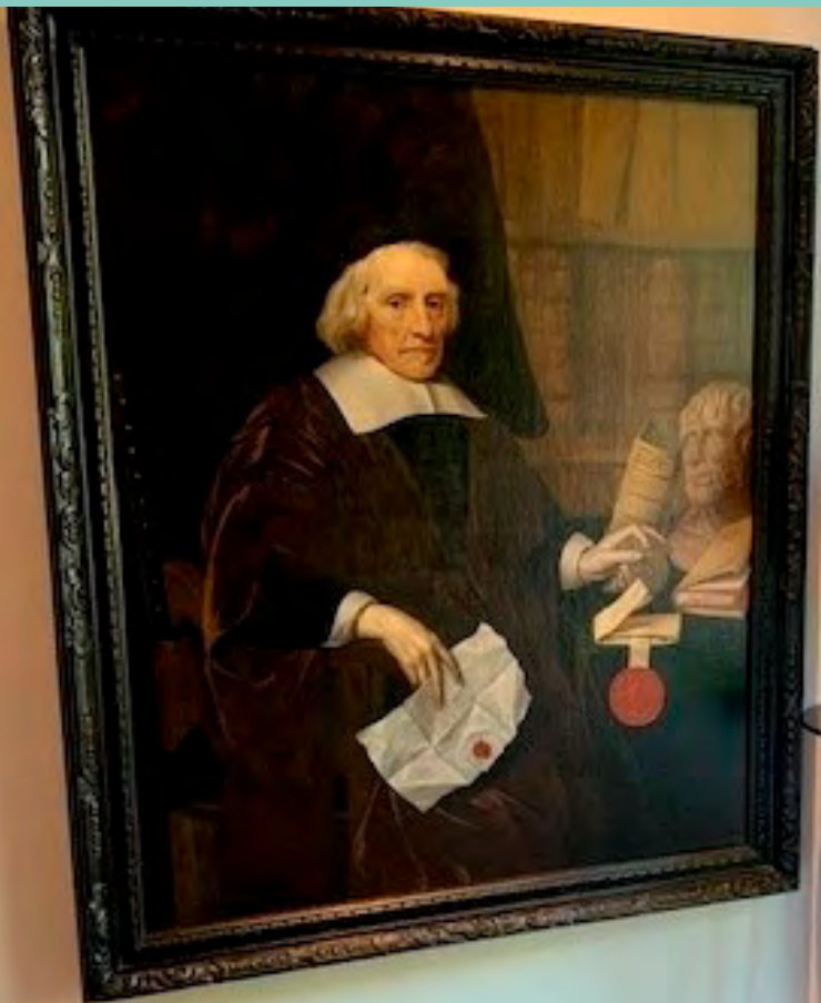
Foto: Schilderij uit de collectie in het Catshuis.