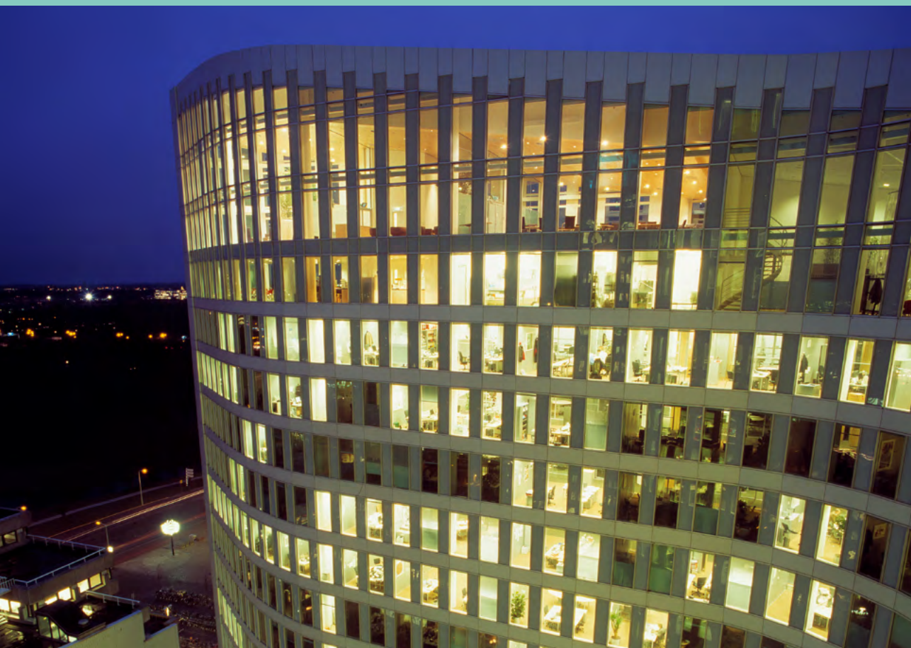
Foto: Een deel van de Hoftoren in Den Haag.