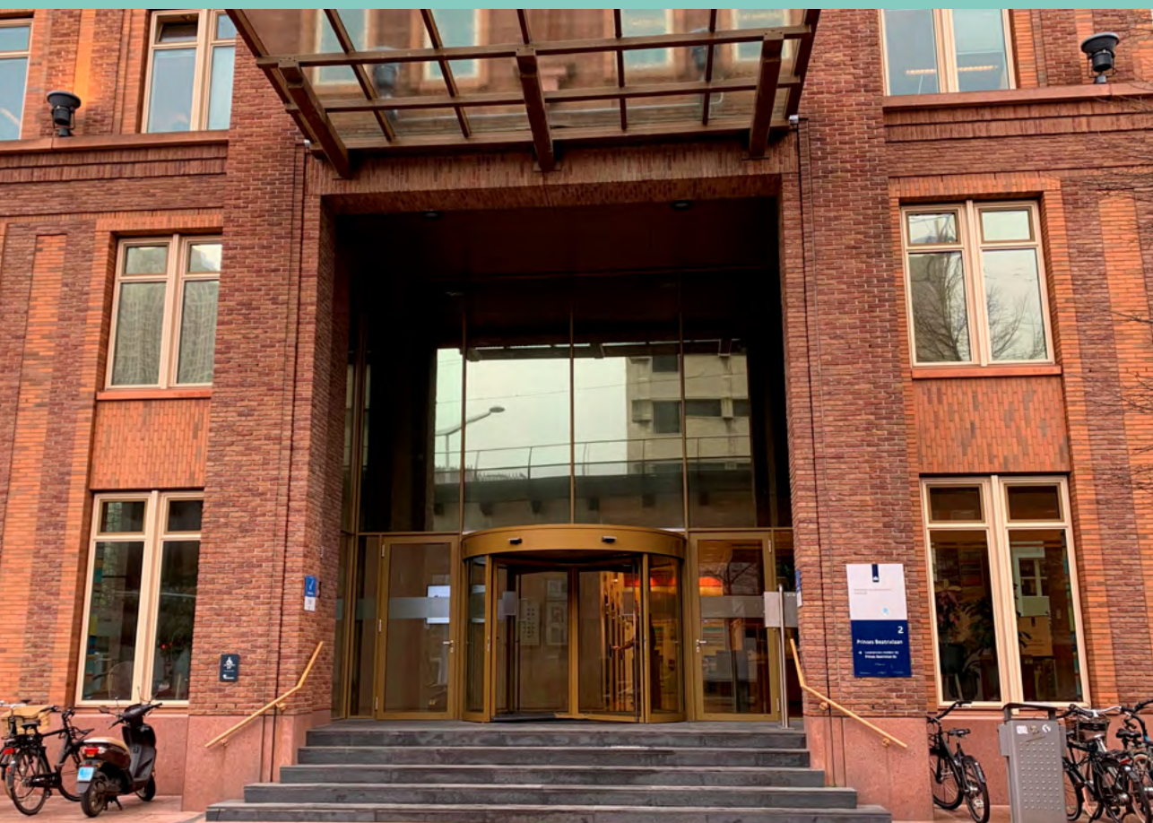
Foto: Entree van de Rijksdienst voor Ondernemend Nederland in Den Haag.