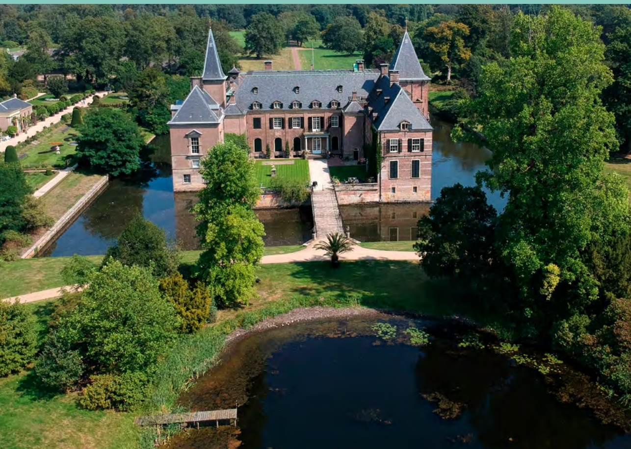
Foto: Luchtfoto Kasteel Twickel in Ambt Delden