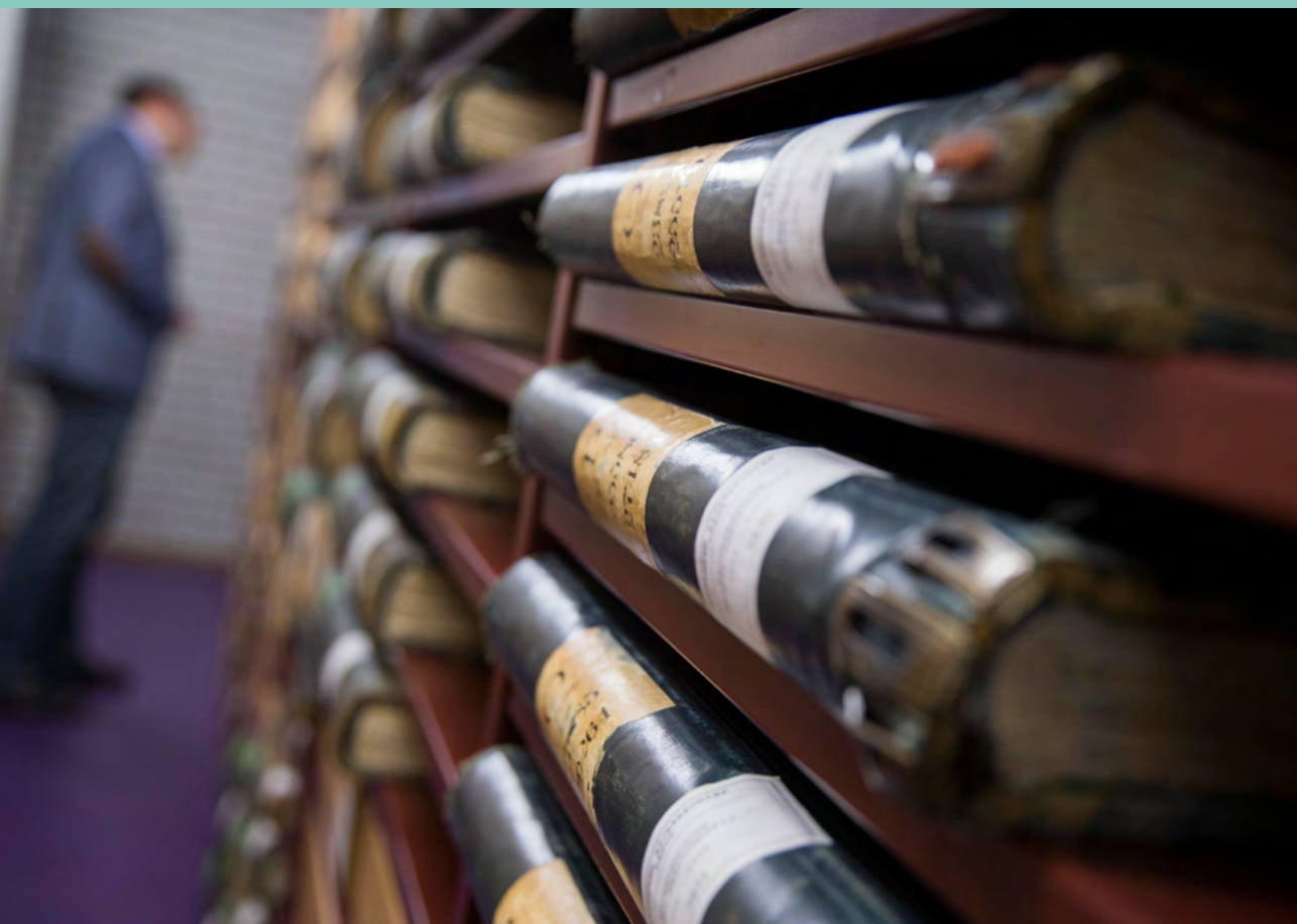
Foto: Historische boeken in een archief.