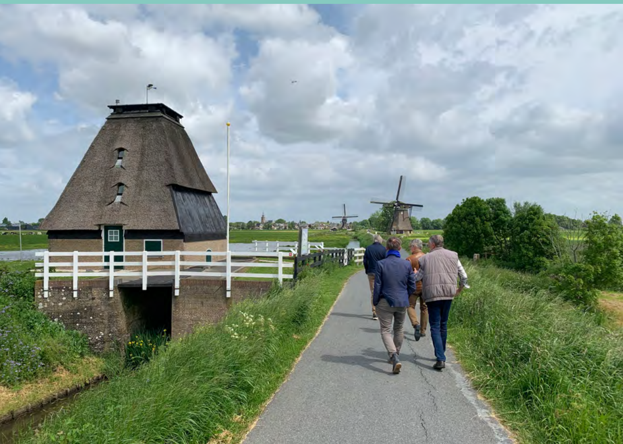
Foto: Inspecteurs in gesprek bij bezoek aan de Hoge Tiendwegmolen, een wipwatermolen, in Streefkerk.