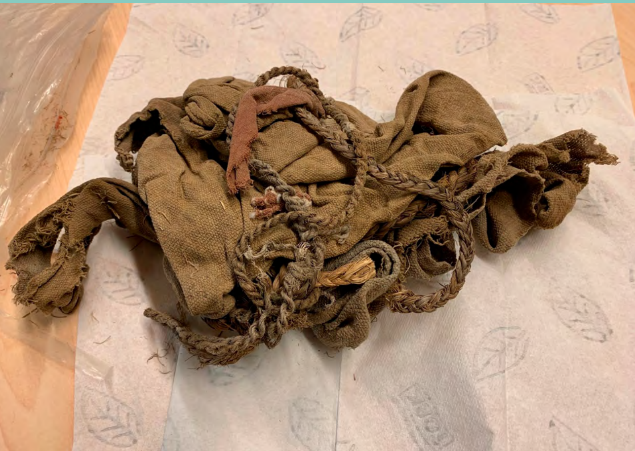
Foto: Peruaanse lijkwade bestaande uit fragmenten van textiel en touw.