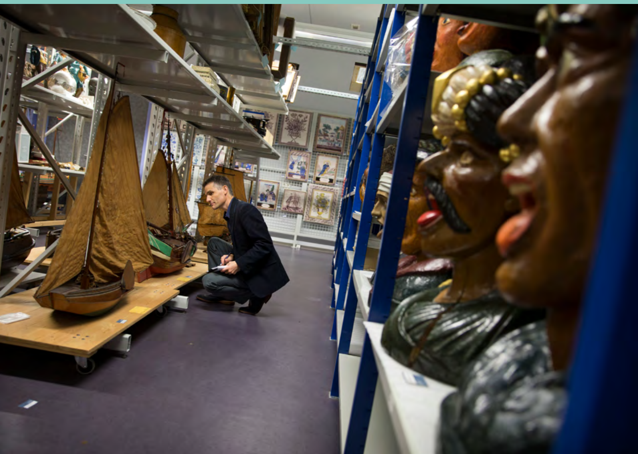
Foto: Inspectie van de Rijkscollectie in het Zuiderzeemuseum in Enkhuizen.