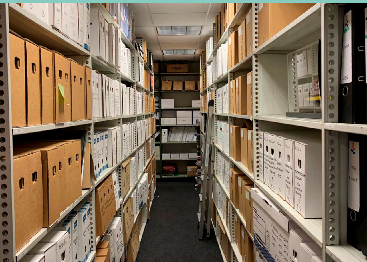
Foto: Archiefruimte in het kantoor van het Loodswezen in Hoek van Holland.