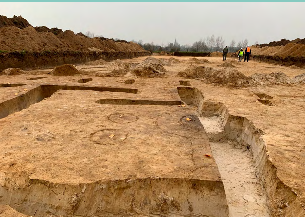
Foto: Archeologisch opgravingsvlak met sporen tijdens de documentatie.