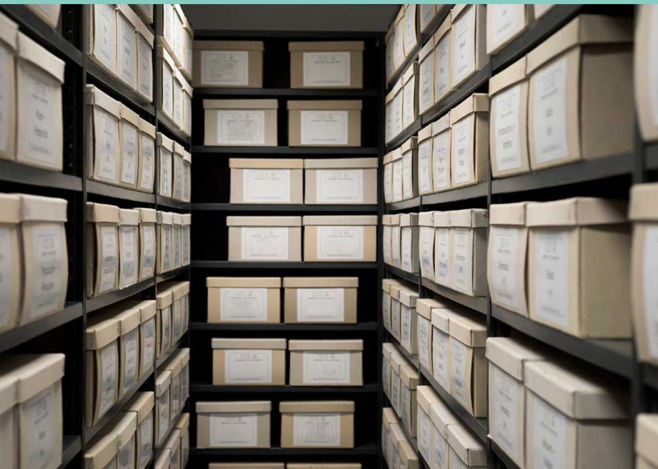
Foto: Opslag met archiefdozen.