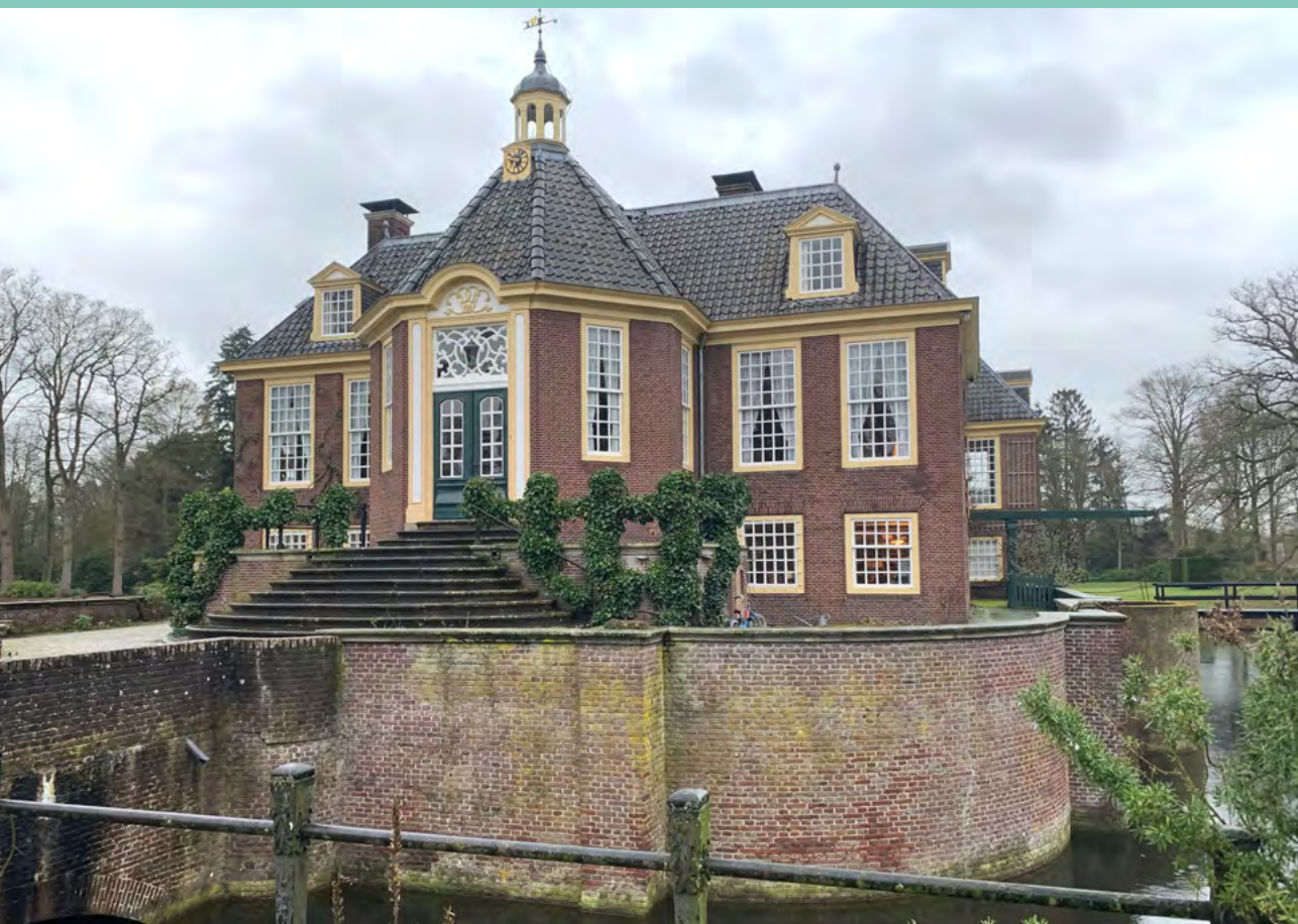
Foto: Kasteel op landgoed de Wiersse in Vorden.