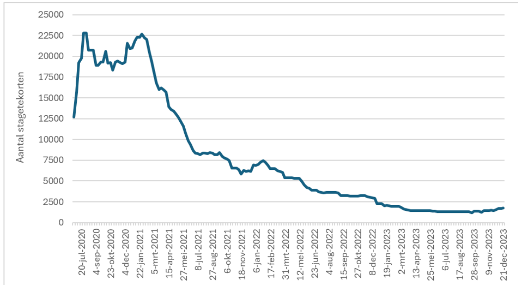
Figuur 1. Ontwikkeling van tekorten aan stages en leerbanen van 10 juni 2020 tot en met 31 december 2023 1

In juli 2020 werd het hoogste aantal absolute tekorten gemeten, met in totaal een tekort van 22.803 stageplekken en leerbanen, gevolgd door een piek van 22.678 tekorten eind januari 2021. Vanaf februari 2021 namen de tekorten gestaag af. Deze daling valt samen met de versoepelingen van de coronamaatregelen. Met de steeds verdere versoepeling van de coronamaatregelen en de intensieve samenwerking tussen leerbedrijven, onderwijsinstellingen en SBB bij de aanpak van tekorten zagen we het aantal tekorten tussen maart 2021 en juli 2021 sterk dalen.