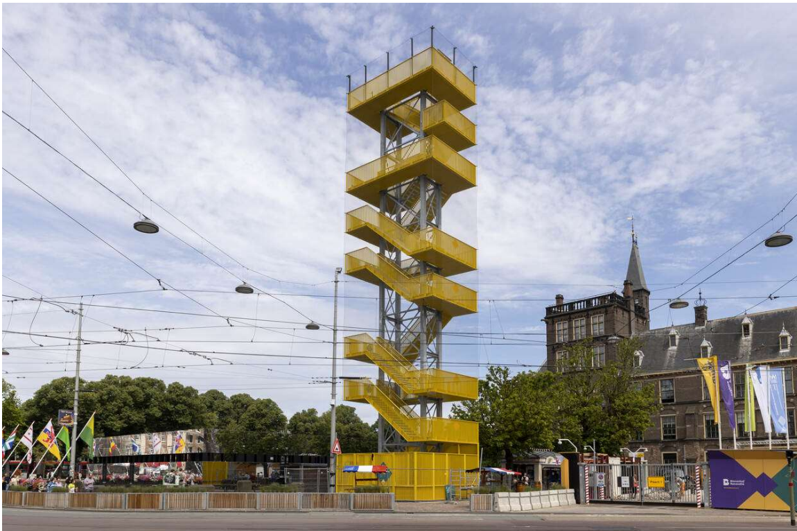
Uitzichtpunt Binnenhof renovatie.