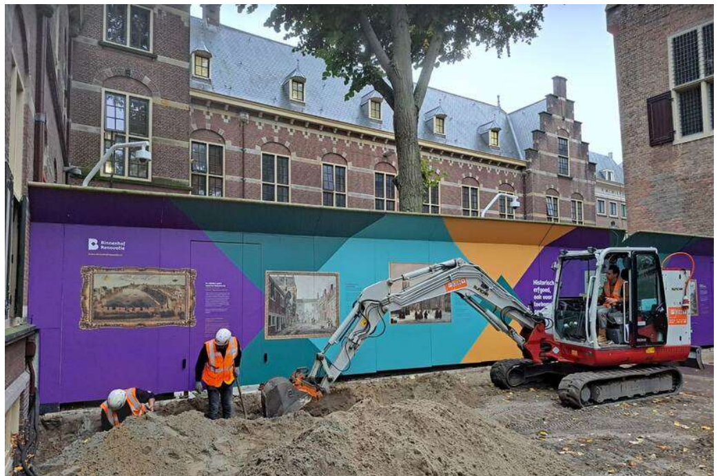
Archeologische opgravingen.

Ook in deze rapportageperiode is er op verschillende plekken archeologisch onderzoek uitgevoerd en zijn er weer bijzondere vondsten gedaan.