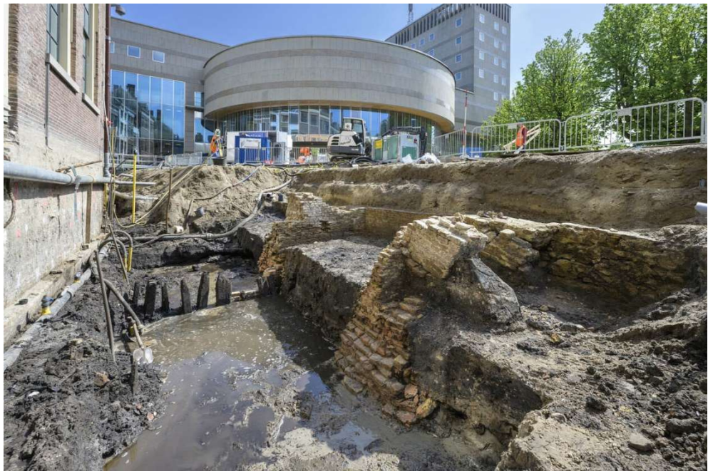
Fundamenten oude brug.

De archeologen zullen verder onderzoek doen naar de opbouw van de brug. Mogelijk zijn er nog oudere funderingen bewaard gebleven die meer inzicht geven in de ouderdom van de brug. Het is niet uit te sluiten dat er in de middeleeuwen al een brug aanwezig was. Een interessant aspect is dat de zijgracht waar de brug over liep al vroeg in de geschiedenis werd gedempt vanwege een nieuw waterafvoersysteem, waardoor de grachtvulling goed bewaard is gebleven.