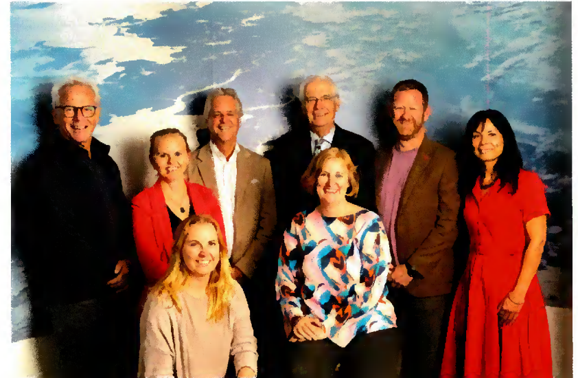
Bestuur en staf 2023.

DINGtiid is in 2022 begonnen met de jaarlijkse DINGtiid-lezing. In 2023 zijn voor de gelegenheid twee lezingen georganiseerd. De grote belangstelling voor deze nieuwe activiteit heeft ervoor gezorgd dat liefhebbers van het Fries uit verschillende werkvelden kennis met elkaar maakten en tot nieuwe plannen zijn gekomen.