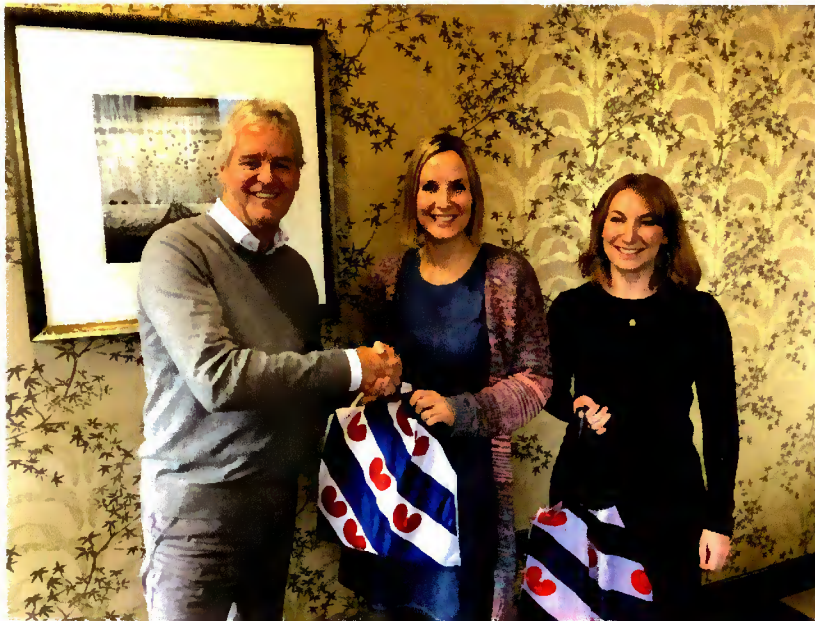
DINGtiid op bezoek in Wales

Leden van bestuur en/of staf hebben hiernaast nog overleggen gevoerd met of vergaderingen bijgewoond van onder andere Mei-inoar foar it Frysk, it Steatekomitee Frysk, Gemeenten&Frysk, de Politike Kommissje (POK) van de Ried fan de Fryske Beweging, Rijksuniversiteit Groningen, Fryske Akademy, Afûk, Tresoar, Europeesk Buro foar Lytse talen, Koninklijke Nederlandse Akademie van Wetenschappen, Rechtbank Noord-Nederland en Gerechtshof Arnhem-Leeuwarden, Gemeente Leeuwarden, Gemeente Waadhoeke, FNP, Vereniging Friese Gemeenten, Stichting Brede Maatskiplike Diskusje, Nationale Dorpentop, Planbureau Fryslân, Joodse School in Amsterdam, Sintrum Frysktalige Berne-opfang, Wy binne mbû, Fierder mei Frysk en Streektaalconferentie Stichting Nederlandse Dialecten.