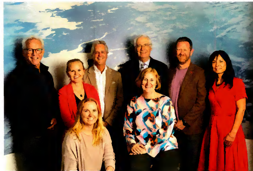
Bestjoer en stêf 2023.

DINGtiid is yn 2022 úteinset mei de jierlikse DINGtiid-lêzing. Yn 2023 binne der foar de gelegenheid twa lêzingen west. De grutte belangstelling foar dizze nije aktiviteit hat derfoar soarge dat nigetawwers fan it Frysk út ferskillende wurkfjilden mei-inoar yn de kunde kaam binne en nije plannen meitsje.